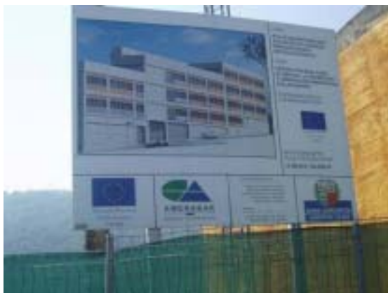
Cartel informativo del proyecto desarrollado en el Centro de Formación Profesional Peñascal.

Las actuaciones de información y publicidad desarrolladas han sido las siguientes: