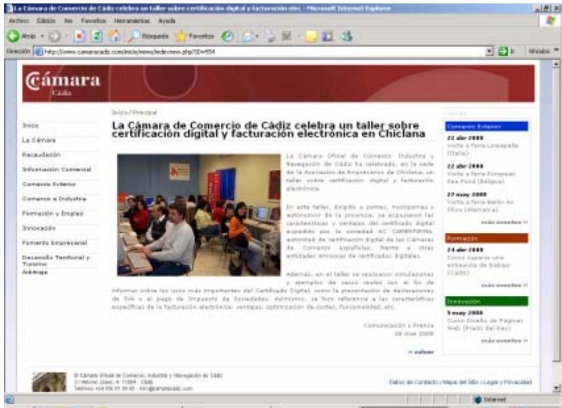
Taller celebrado en la Cámara de Comercio de Cádiz

A su vez, las Cámaras de Comercio se encargan de hacer publicidad de los talleres a través de sus respectivas páginas Web. Véase, a modo de ejemplo, la información aparecida en la Web de las Cámaras de Comercio de Cádiz y Orense.