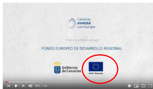
Convocatoria Anticipada Red CIDE 2018

https://www.youtube.com/watch?list=PLkPZWFwWdAjRoz4hNYjF5Y0lu4kp6jWgG&v=gwFpAolXbQ0