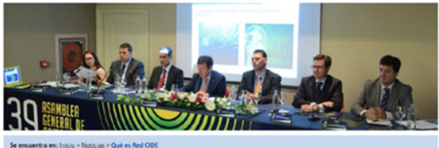
Se encuentra en: Inicio > Noticias > Qué es Red CIDE