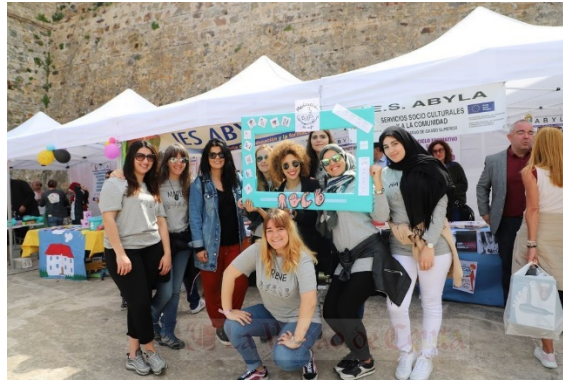
Exposición “Ayer y hoy de los Fondos Europeos en Ceuta”