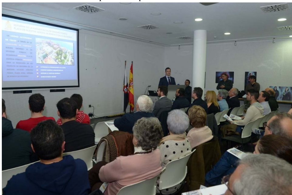
Acto público de presentación de obras