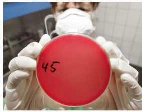
Una científica muestra en un laboratorio de Logroño.

Esta iniciativa se enmarca en el objetivo temático uno del programa operativo FEDER La Rioja 2014-2020