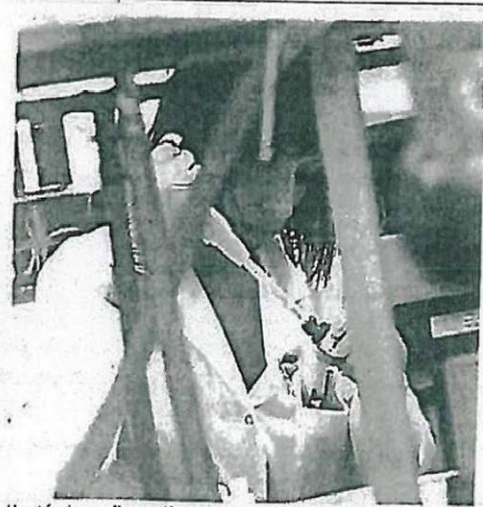
Una técnico realiza analíticas en la Enológica de Haro.

En este sentido, y con el fin de mantener esa posición de liderazgo en el futuro, la consejera señalaba