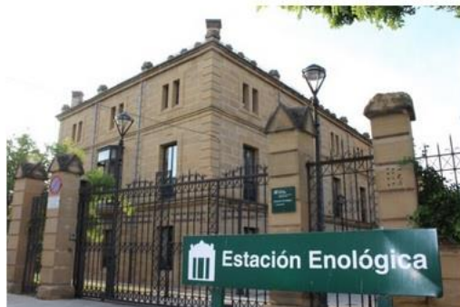
Vista de la Estación Enológica de Haro, que cumple 125 años este 2017, ayer por la tarde.

La entidad vinícola, que celebra su 125 aniversario, incorporará un nuevo laboratorio