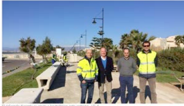
El delegado Surabta de infraestructuras visita obra.

• La Junta rehabilitará casi un kilómetro en el tramo que discurre entre el edificio Jaleo