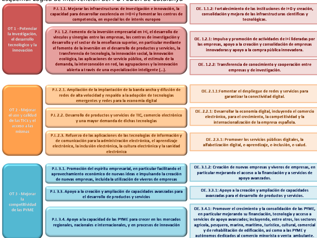
Esquema. Lógica de intervención del PO FEDER de Catalunya

El siguiente Esquema muestra los principales componentes de la lógica de intervención seguida en el mismo.