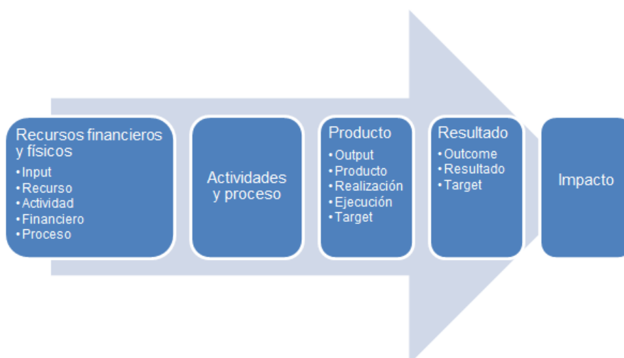
Figura 1. Terminología sobre indicadores empleada en los documentos de Fondos EIE. Reglamentos del periodo 2014-2020

Fuente: Evaluación ex ante del Acuerdo de Asociación