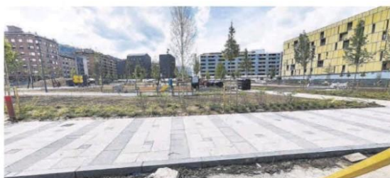
El estado de las obras del parque de la Mayacina, en la mañana de ayer.