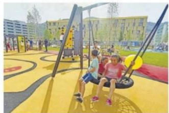
Zona de juegos infantiles del parque de la Mayacina. A la derecha, vista general del nuevo espacio verde más ser inaugurado.