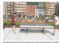
El nuevo espacio incluye mesas para jugar al ping-pong y al ajedrez.

campomanes declaraba que estaban «satisfechos» en el equipo de gobierno por el resultado logrado. «Pero lo importante es que sean los vecinos los que estén contentos». Destacaba que se trata de un espacio público que se va a utilizar para actividades deportivas o recreativas. «Era una antigua área industrial, una parcela degradada y que ahora constituye un eje importante para unir la parte este y oeste de la ciudad». Por su parte, el alcalde recordó que «la ciudadanía estuvo aguantando durante años polvo y de todo; desterramos el marzón de tierra que había. Es una buena obra».