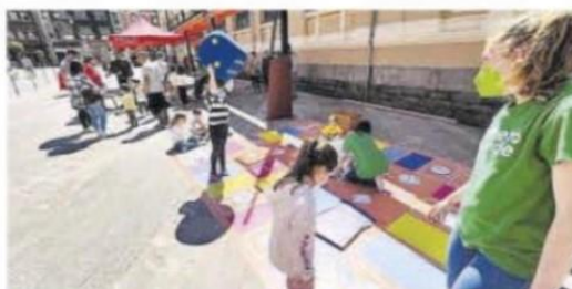
Actividades del Día de Europa en Mieres. | A. V.