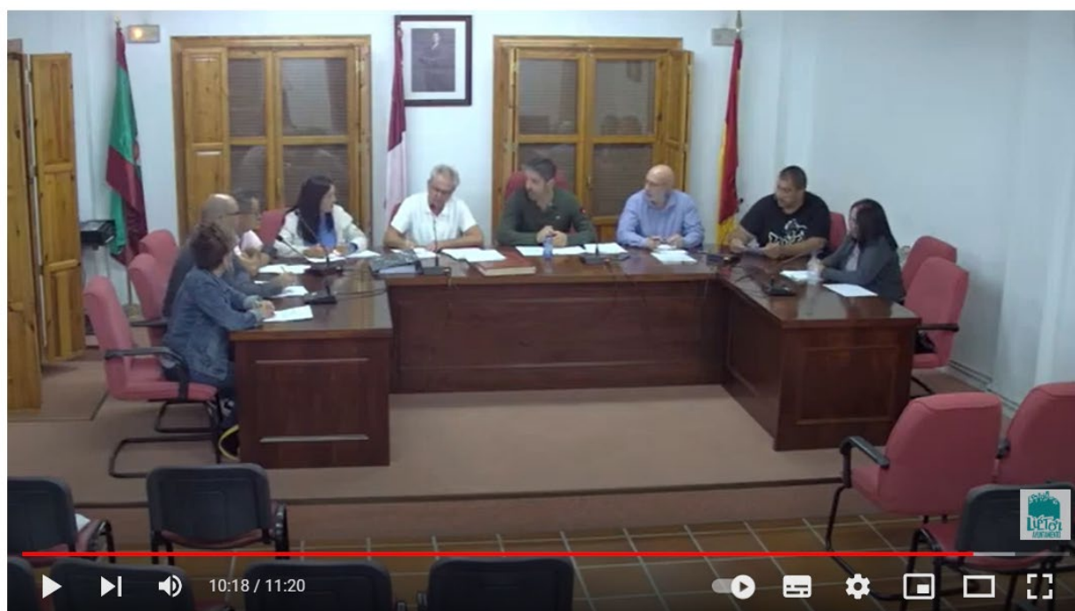
PLENO ORDINARIO DEL 29 DE SEPTIEMBRE DE 2022 A LAS 21 00 AYUNTAMIENTO DE LIETOR

Plenary session of Liétor recorded through the new video record system: