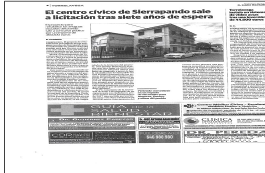
Nota de prensa de 21 JULIO 2020 El Diario Montañés (fin licitación)