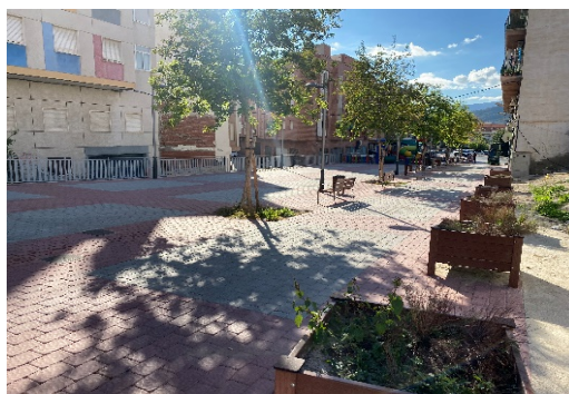
Foto después de la actuación

Con el cubrimiento y la adecuación de la Rambla del Realejo se ha conseguido eliminar el problema de la accesibilidad y la comunicación entre ambos barrios, favoreciendo la movilidad peatonal y la accesibilidad universal. Además, se han creado lugares de recreo y esparcimiento en dos barrios desfavorecidos, mejorando la cohesión social de sus habitantes.