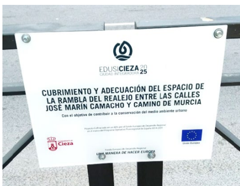
Foto de la placa metacrilato

Al finalizar las obras, se han colocado dos placas permanentes . La primera de ellas es una placa de metacrilato, que se realizó a la finalización del segundo tramo. La segunda placa permanente se trata de una placa de acero, que se descubrió el día del evento de inauguración de la Rambla del Realejo.