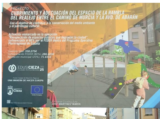
Foto cartel temporal de obra

Durante la ejecución de las obras se instaló un cartel temporal con el fin de resaltar el papel clave de los fondos FEDER para la ejecución del proyecto.