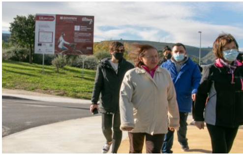
Cartelera de obra