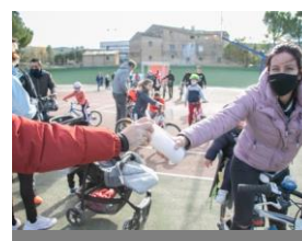
Actividades del evento para la ciudadanía. Merchandising