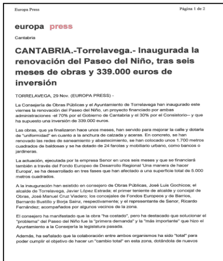
Nota de prensa de 29 NOVIEMBRE 2019