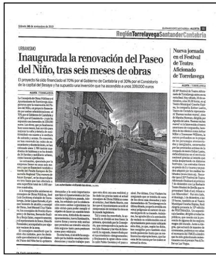
Nota de prensa de 30 NOVIEMBRE 2019