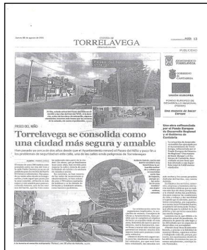
Nota de prensa de 12 AGOSTO 2021