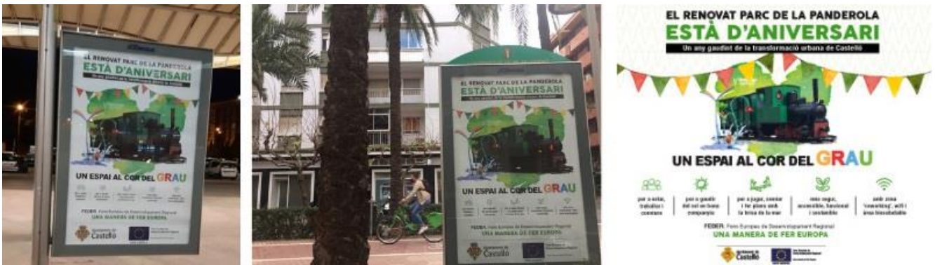
Publicidad en medios digitales y mupis instalados en varias calles de la ciudad de Castelló.

En octubre de 2021 se realizó una jornada de puertas abiertas en el parque de la Panderola con música en directo, reparto de merchandise y actividades y talleres familiares para invitar a la ciudadanía a disfrutar del renovado espacio. Se instaló un mural donde el público pudo plasmar con dibujos y mensajes su visión sobre el nuevo parque. El acto, publicitado a través de redes sociales, prensa y radio, reunió a 500 personas.