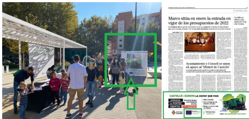
Jornada de puertas abiertas y faldón para anunciar la celebración.

En octubre de 2021 se realizó una jornada de puertas abiertas en el parque de la Panderola con música en directo, reparto de merchandise y actividades y talleres familiares para invitar a la ciudadanía a disfrutar del renovado espacio. Se instaló un mural donde el público pudo plasmar con dibujos y mensajes su visión sobre el nuevo parque. El acto, publicitado a través de redes sociales, prensa y radio, reunió a 500 personas.