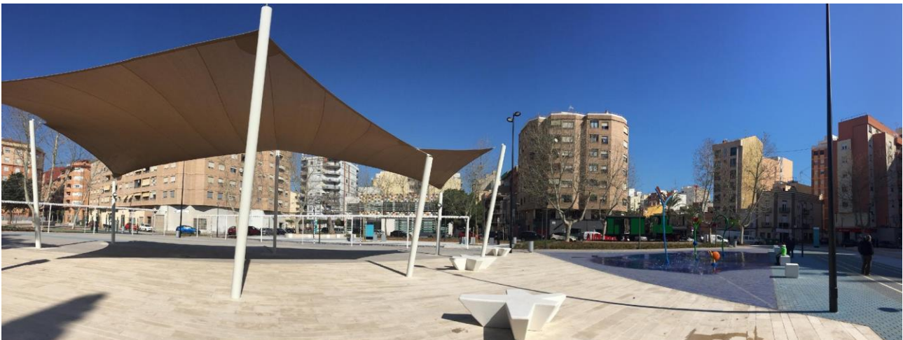
Carpa central del parque.

Por otro lado, las mencionadas mejoras implementadas, y la apuesta por una arquitectura diáfana que garantiza la accesibilidad y seguridad del parque, han atraído a nuevos y nuevas usuarias, convirtiendo esta plaza en pleno corazón del Grau en un lugar de gran afluencia por todo tipo de públicos.