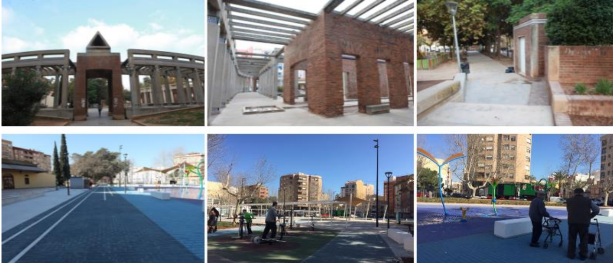
El parque, antes (imagen superior) y después de su remodelación.

Junto a la eliminación de los muros y zonas porticadas que restaban visibilidad en el interior del parque, la seguridad se ha ganado también de la mano de un refuerzo de la iluminación, que se transforma a LED, un tipo de tecnología que mejora el reconocimiento facial, que es más uniforme -no genera zonas de sombra- y se ajusta a la superficie que se quiere iluminar.