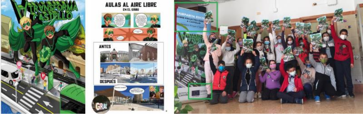
Portada y página interior del cómic Transforma Castelló y una de las sesiones organizadas en los colegios

El renovado parque de La Panderola se incluye en el cómic ‘Transforma Castelló’, que resume toda la inversión del FEDER en la ciudad y que ha llegado a más de 700 escolares de Primaria a través de una campaña divulgativa realizada en los colegios castellonenses.