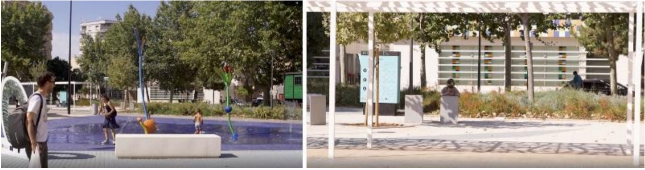
Fuente central y zona 'coworking' del parque de La Panderola