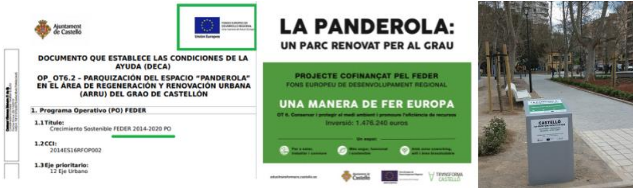
DECA de la operación y placa instalada en uno de los accesos al parque.

Se han cumplido las obligaciones mínimas reglamentarias en la documentación oficial (DECA) así como la placa o la inclusión en el portal web único ( www.edusitransformacs.castello.es )