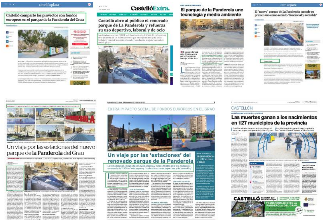
Noticias y publirreportajes publicados sobre la operación.

Se han remitido desde el gabinete de prensa del Ayuntamiento de Castelló varias notas de prensa que han tenido su posterior impacto en medios de comunicación de ámbito provincial, autonómico y nacional, escritos y digitales. Además se han realizado campañas publicitarias con la contratación de publirreportajes en los periódicos El Mundo y Mediterráneo, y de faldones publicitarios en ambos medios.