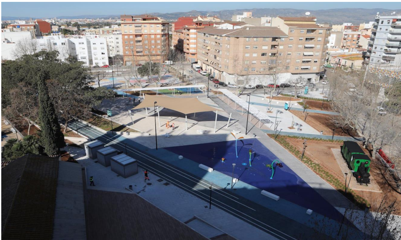
Vista aérea del parque de La Panderola del Grau.

Presentamos como buena práctica la remodelación integral del parque de la Panderola del Grau, en el distrito marítimo de Castelló. Un proyecto que ha permitido transformar esta plaza de 11.300 metros cuadrados próxima al puerto en un área totalmente accesible, más funcional y más segura, al reforzar la iluminación, que incorpora sistema LED, y convertirla en un espacio diáfano.