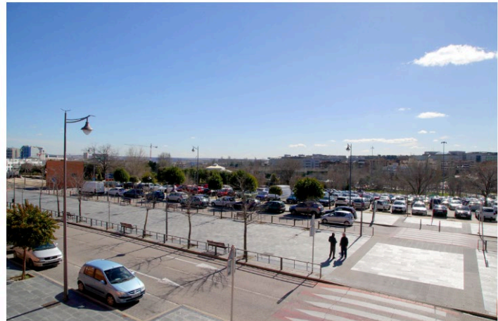
ALCOBENDAS COFINANCIARÁ CON FONDOS FEDER UN APARCAMIENTO, UN CENTRO DE EMPRENDIMIENTO Y LA RENOVACIÓN DE PAZ Y HUERTAS Estas tres primeras inversiones de la Estrategia DUSI supondrán una inversión total de 4.070.000 euros, aportadas a partes iguales por el Ayuntamiento y los fondos FEDER Alcobendas sigue adelante con la Estrategia Desarrollo Urbano Sostenible e Integrado (DUSI) presentada para su cofinanciación por el Fondo Europeo de Desarrollo Regional (FEDER). El coste total del proyecto hasta 2020 asciende a 6.856.352 euros, aportados a partes iguales por el Ayuntamiento y FEDER.

En el apartado de comunicación reglamentaria, se ha colocado un panel informativo y una placa sobre la cofinanciación europea de esta actuación y también aparece en el portal web de Edusi Alcobendas. Meses antes de que se iniciaran las obras, desde el Departamento de Comunicación y Redes Sociales ya se enviaron varias notas de prensa sobre esta actuación y otros proyectos previstos, que se financiarían en la ciudad gracias al fondo FEDER.