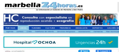
Marbella concluye el despliegue de la segunda fase de videovigilancia

El proyecto ha contado con una inversión superior a los 974.000 euros cofinanciada al 80 por ciento por el Fondo Europeo de Desarrollo Regional (FEDER), en el marco del Programa Operativo Plurirregional de España 2014- 2020 y de la Estrategia de Desarrollo Urbano Sostenible (EDUSI).