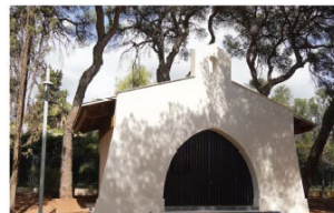
El Consistorio ha ejecutado una completa remodelación de la capilla.

Para la revitalización urbana y medioambiental del Vigil de Quiñones, el Ayuntamiento ha destinado más de medio millón de euros cofinanciados al 80 por ciento por el Fondo Europeo de Desarrollo Regional (FEDER) en el marco del Programa Operativo Plurianacional de España 2014-2020, con el que se ha conseguido aunar los conceptos de parque-jardín y espacio urbano. En este punto, la alcaldesa explicó que la puesta en valor de este pulmón verde "forma parte de la línea de trabajo que estamos impulsando en materia de mejora, rehabilitación y recuperación de los espacios urbanos y naturales para ponerlos al servicio de la ciudadanía".