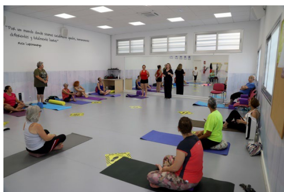
ACTIVIDAD PILATES AULA DE VERANO “CRECIENDO JUNTAS”, C.C. “LOS SILOS”.

El Centro Cívico “Los Silos” está acogiendo muchas actividades en el marco del “Programa Mujer-Es”, programa de actividades del Área de Igualdad, fomentando un feminismo plural, creativo, reivindicativo y transformador. Una de las actividades más destacables se está llevando a cabo actualmente en el Aula de Verano “Creciendo Juntas”, ofreciendo a las usuarias talleres de yoga y pilates, que trabajan la autonomía y la salud de las mujeres de la localidad.