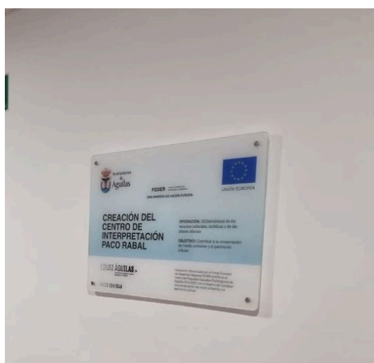
Foto placa permanente Centro de Interpretación Paco Rabal

En relación a la comunicación complementaria , los medios de comunicación tradicionales y digitales se han hecho eco de las evoluciones de la actuación, informando en prensa , que pertenece a la Estrategia de Desarrollo Urbano Sostenible e Integrado Águilas SOStenible, destacando la cofinanciación por el Fondo Europeo de Desarrollo Regional FEDER al 80%.