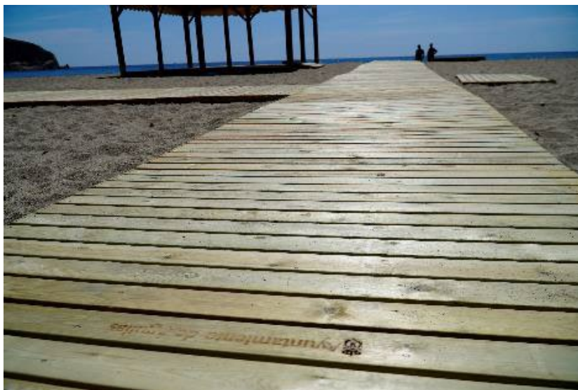
Foto pasarela playa

Esta actuación se encuentra dentro de la línea de sostenibilidad de los recursos culturales, turísticos y de las playas urbanas. De forma paralela a la habilitación de la primera planta de la Casa de Cultura para instalar el Museo del Carnaval y el Centro de Interpretación del actor Francisco Rabal, se han llevado a cabo el acondicionamiento de las playas urbanas de Águilas. Esta actuación tiene un importe de 330.607,09 €, del que un 80% (264.485,67 €) han sido cofinanciados por el FEDER.