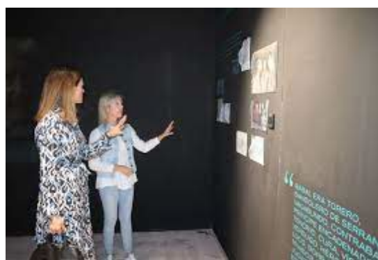
Foto Centro de Interpretación Paco Rabal

Esta actuación ha supuesto un coste total de 238.606,42 €, que se ha cofinanciado en un 80% por el Fondo Europeo de Desarrollo Regional (FEDER), que ha aportado un total de 190.885,14 €.