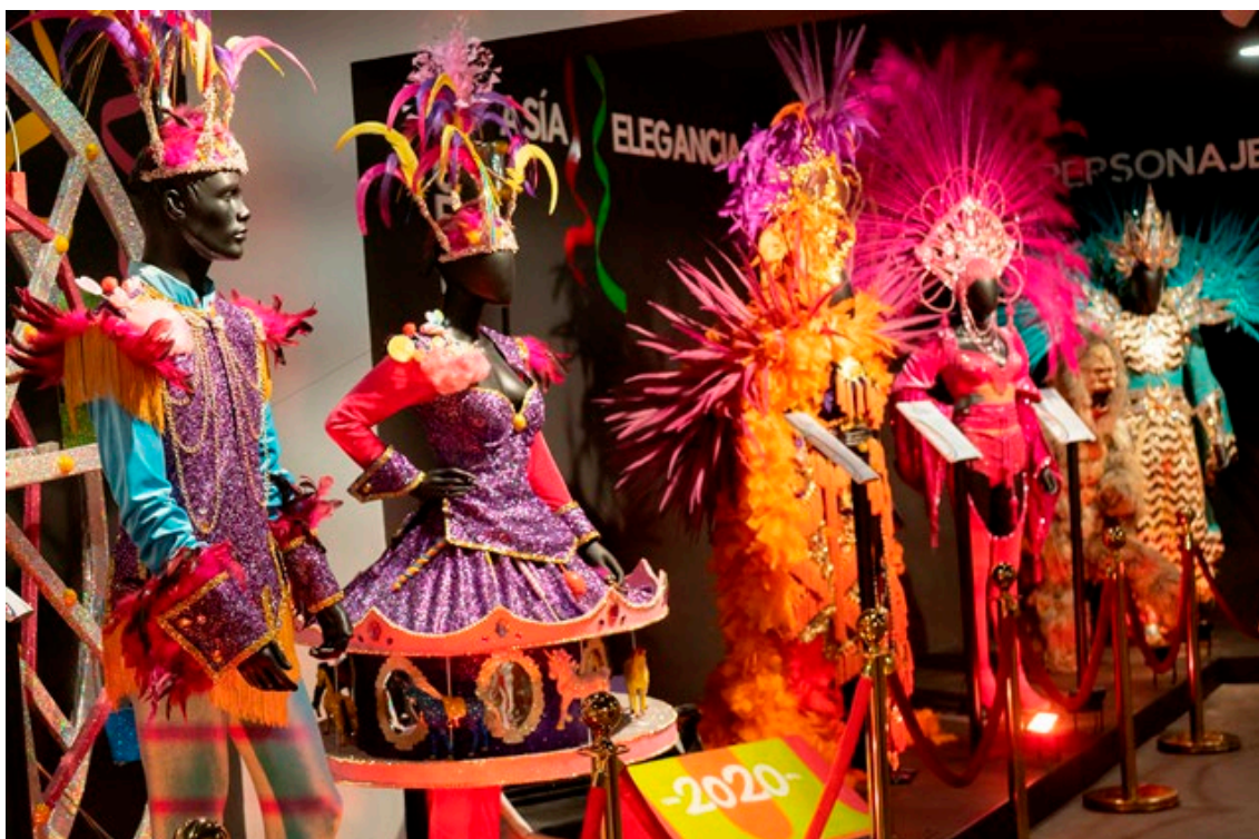
Vestimenta del Carnaval de 2020

Por otro lado, gracias a esta actuación, tanto la ciudadanía como los turistas tienen la oportunidad de aprender, recordar y valorar parte del patrimonio cultural de Águilas, en unos espacios adecuados y adaptados para todo tipo de público.