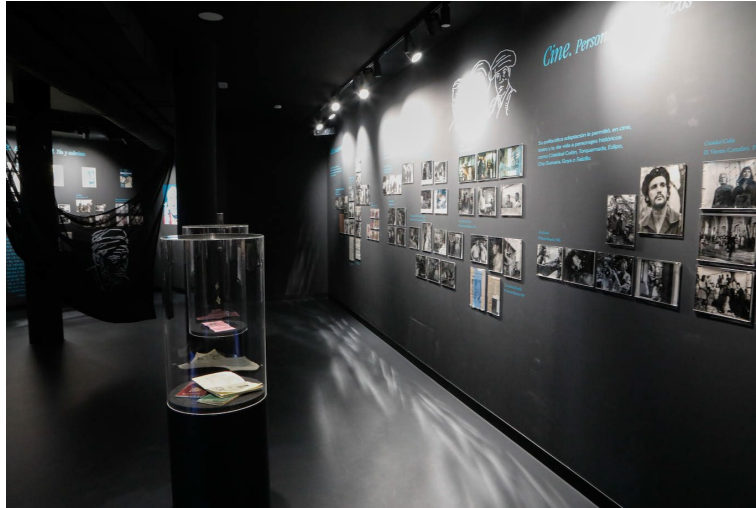
Foto de parte de la exposición del Centro de Interpretación Francisco Rabal.

Además, este tipo de actuaciones que implican un nuevo atractivo cultural y turístico, suponen la reactivación del sector comercial del entorno y en consecuencia, puede llevar acarreada un incremento de la empleabilidad. Es importante señalar que, la apertura no supondrá un gasto extra en personal, ya que estas instalaciones ya contaban con encargados de la apertura y cierre diarios.