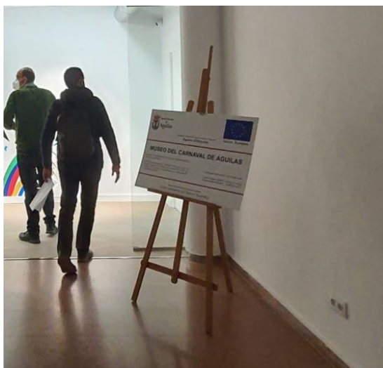
Foto cartel temporal del Museo del Carnaval

Durante la ejecución de la obra, se han colocado los correspondientes carteles temporales de obra que indicaban el inicio de las actuaciones, en la entrada del edificio de la Casa de la Cultura, en los que aparece el nombre de la actuación, la operación en la que se enmarca, el presupuesto de la obra, así como la cofinanciación municipal y del FEDER. Posteriormente, al finalizar la obra, se colocaron unas placas permanentes donde aparece: el nombre de la actuación, la operación en la que se enmarca y su objetivo.