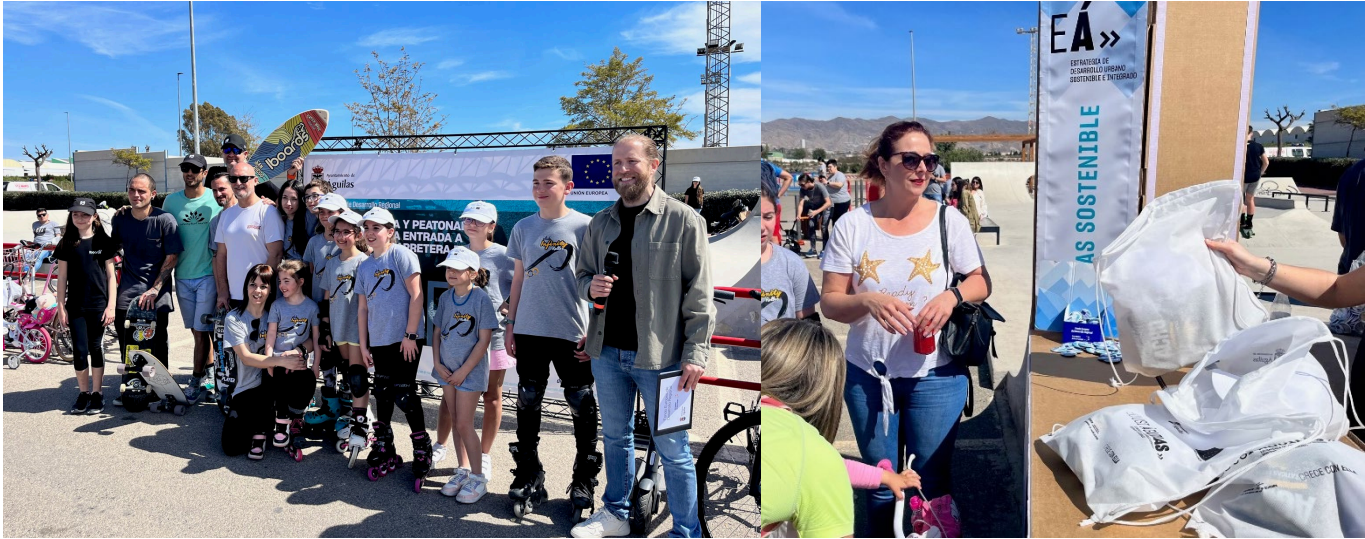
Fotografía de algunos de los participantes y merchandising distribuidos el día del evento

En definitiva, se ha llevado a cabo una intensa labor de difusión de la actuación, reflejando que se ha cofinanciado por el Fondo Europeo de Desarrollo Regional FEDER al 80%, en el marco del Programa Operativo Plurirregional de España POPE 2014-2020.