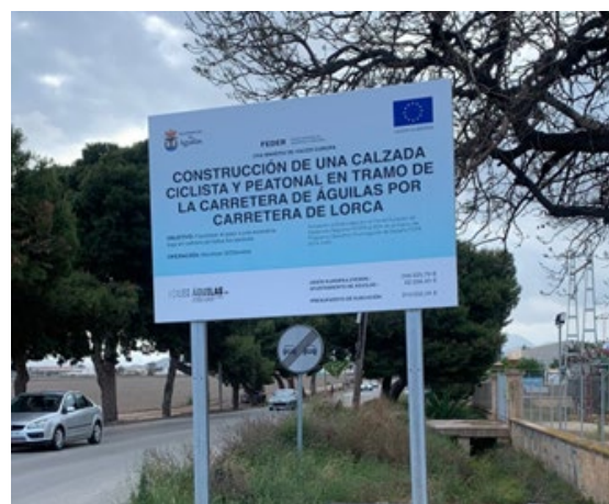
Cartel temporal de obra del tramo a Calabardina y del tramo de la entrada a Águilas