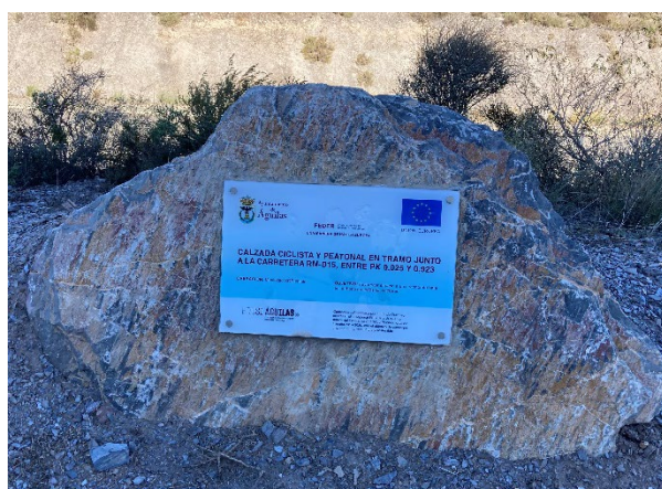
Placa permanente del tramo a Calabardina