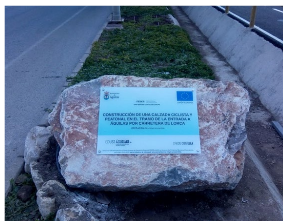
Placa permanente del tramo de la entrada a Águilas

Por otro lado, en cuanto a la comunicación complementaria , se ha elaborado un vídeo con subtítulos en inglés y un micro vídeo para insertar en redes sociales, en los que se recoge el impacto de las actuaciones.