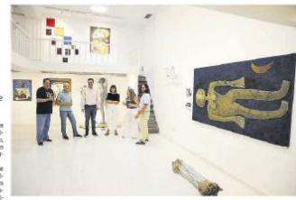
El artista, los comisarios de la exposición y representantes del Cabildo, el viernes, en la inauguración de la exposición