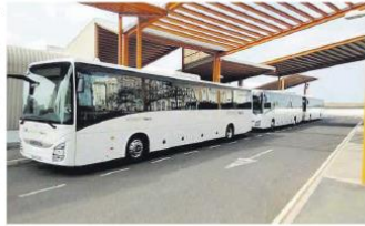
Parque del servicio interurbano de Lanzarote | IBERO DE LAS PALMAS