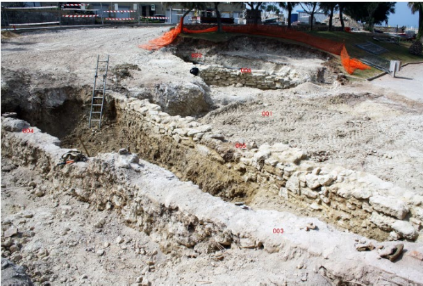
Restos localizados del Fuerte de Santiago