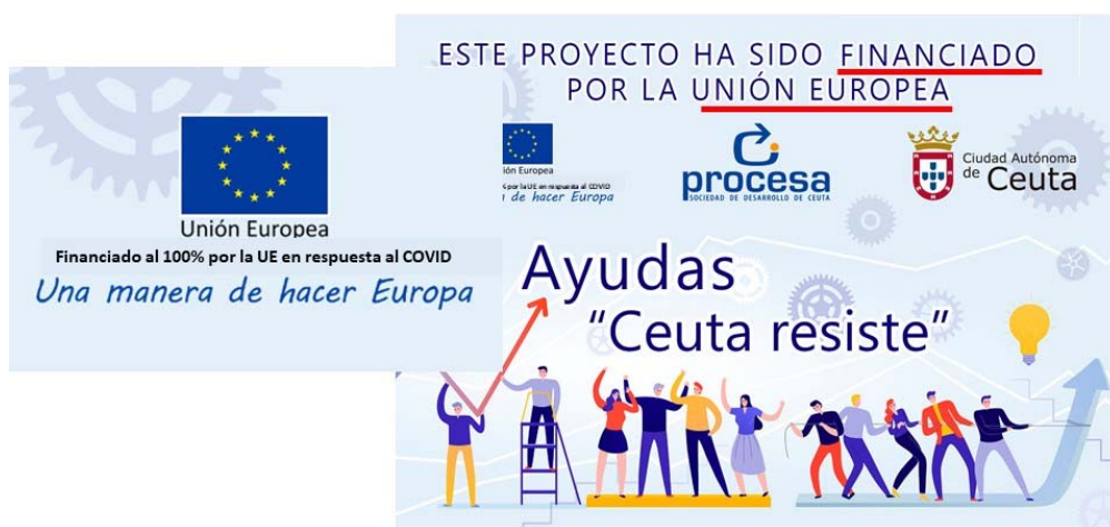
Entrevista a la Consejera de Economía y Hacienda en TV local para explicar la línea de ayudas financiada al 100% por la Unión Europea