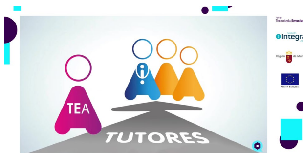
el que se conconcentra inmersa. Fundación Integra.

Presentación en el I Foro digital de “Tecnología emocional”