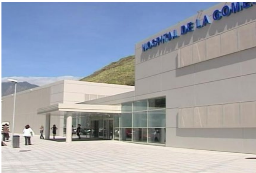
*Entrada principal del Hospital de La Gomera