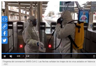
Fotografía del coronavirus SARS-CoV2. Los técnicos sellan los frascos de los virus aislados en Valencia.