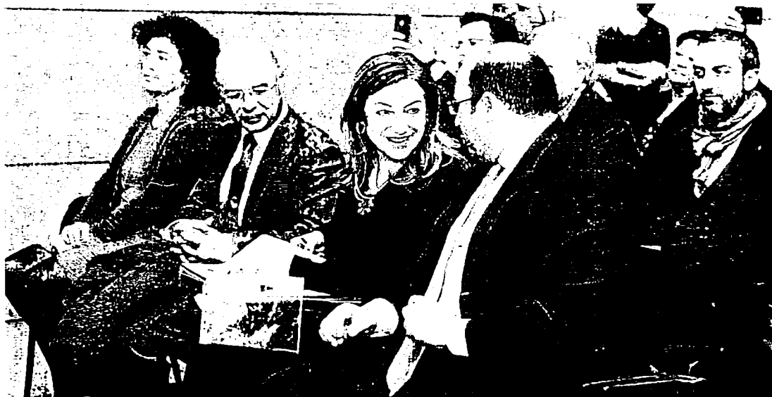
La secretaria de Estado de Presupuestos, Marta Fernández, conversa con el presidente Sánchez. A su lado, el consejero Carrillo.

En cuanto a la educación, el Plan Estratégico destaca que a pesar de los avances de los últimos años, el nivel es inferior a la media española. La población analfabeta mayor de 16 años roza el 4%, casi dos puntos por encima de la media; el abandono educativo temprano era del 26,9% en el año 2013, el doble que el promedio de la UE; y la tasa bruta de graduados en la ESO está casi cinco puntos por debajo, entre otros parámetros que no favorecen a la Región. Unido a esto, hay que mejorar las infraestructuras educativas. El parque de centros es bastante antiguo: hay 50 institutos y 302 colegios con más de 26 años de vida; y otros 57 que superan los 50 años. Denuncia asimismo la existencia de aulas prefabricadas en una docena de municipios.