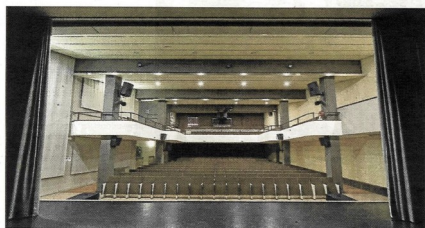
La Casa de la Cultura de Almassora abre ahora los doce meses del año.

De hecho, el balance de los técnicos municipales resalta el impacto de ciclos como el de jazz, conexiones en directo y diletado con la Royal Opera House de Lon-