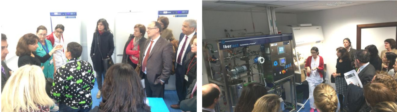
Dos momentos de la visita al Banco de Leche: sala de congeladores (izquierda) y sala de pasteurización (derecha)

A continuación, tuvo lugar una visita a las salas de congelación y de tratamiento de la leche materna, donde hubo ocasión de ver el equipamiento adquirido en los proyectos de investigación cofinanciados con cargo al FEDER.