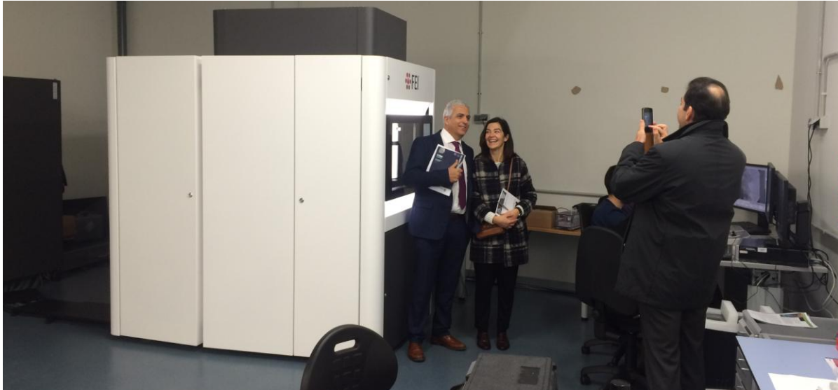
Asistentes a la visita delante del microscopio electrónico de transmisión y barrido con fuente de emisión de campo FEG S/TEM, para análisis microestructural

Posteriormente se visitaron los distintos laboratorios del centro, teniendo ocasión de conocer el alto grado de equipamiento tecnológico y científico del mismo.