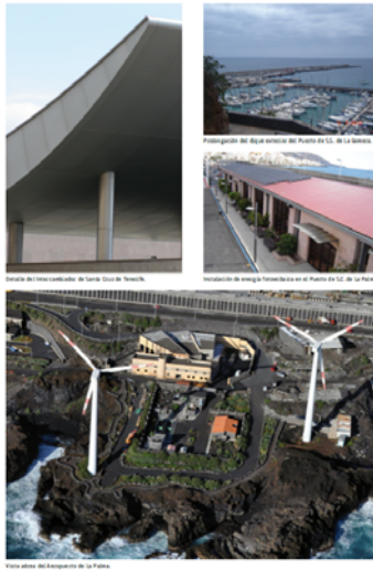
Detalle del nuevo edificio de Santa Cruz de Tenerife. Instalación de energía fotovoltaica en el Puerto de La Palma. Vista aérea del Aeropuerto de La Palma.