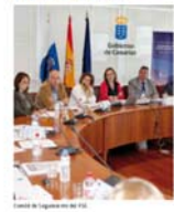
Comité de Seguimiento del PO.

La Dirección General de Planificación y Presupuesto del Gobierno de Canarias y la Subdirección General de la Unidad Administrativa del Fondo Social Europeo del Ministerio de Trabajo e Inmigración, coordinadas por el director del comité de seguimiento del Programa Operativo del Fondo Social Europeo, celebrado el 24 de junio, aprobó el informe final de ejecución de los proyectos iniciados en 2009 por un importe de 20 millones de euros.