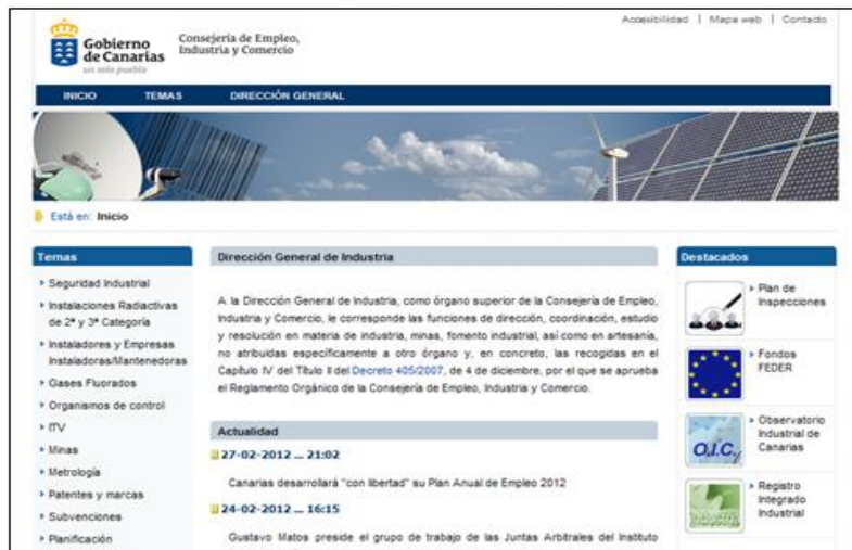
PÁGINA WEB DE INDUSTRIA.

3. En la página web de la Dirección General de Industria ( www.gobiernodecanarias.org/industria ), se ha incluido como un destacado con el título “Fondos FEDER”, desde el que se accede a la información y direcciones de interés. Esta publicidad es común tanto para los convenios como para las convocatorias.