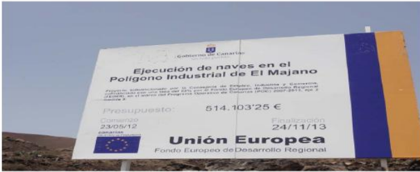
Fecha de elaboración: marzo 2014

Respecto al punto 3 de la ficha, se adjuntan a continuación tres fotos correspondientes a los carteles de las obras ejecutadas por los Cabildos de El Hierro, La Palma y Fuerteventura.