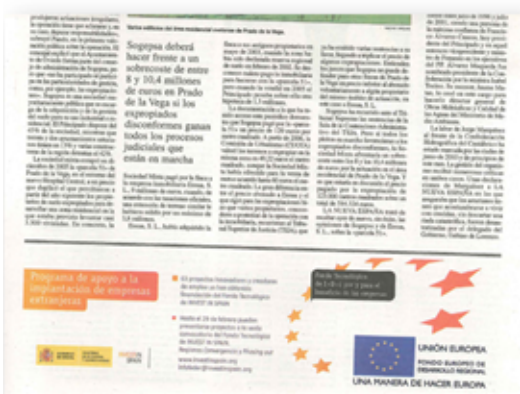
Anuncio en prensa "La Nueva España" para jornada de Asturias