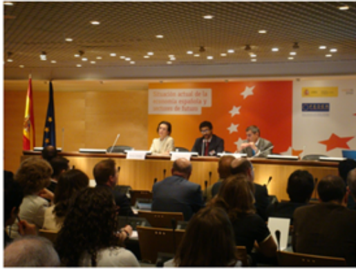
Jornada Madrid- 22 de Mayo de 2009