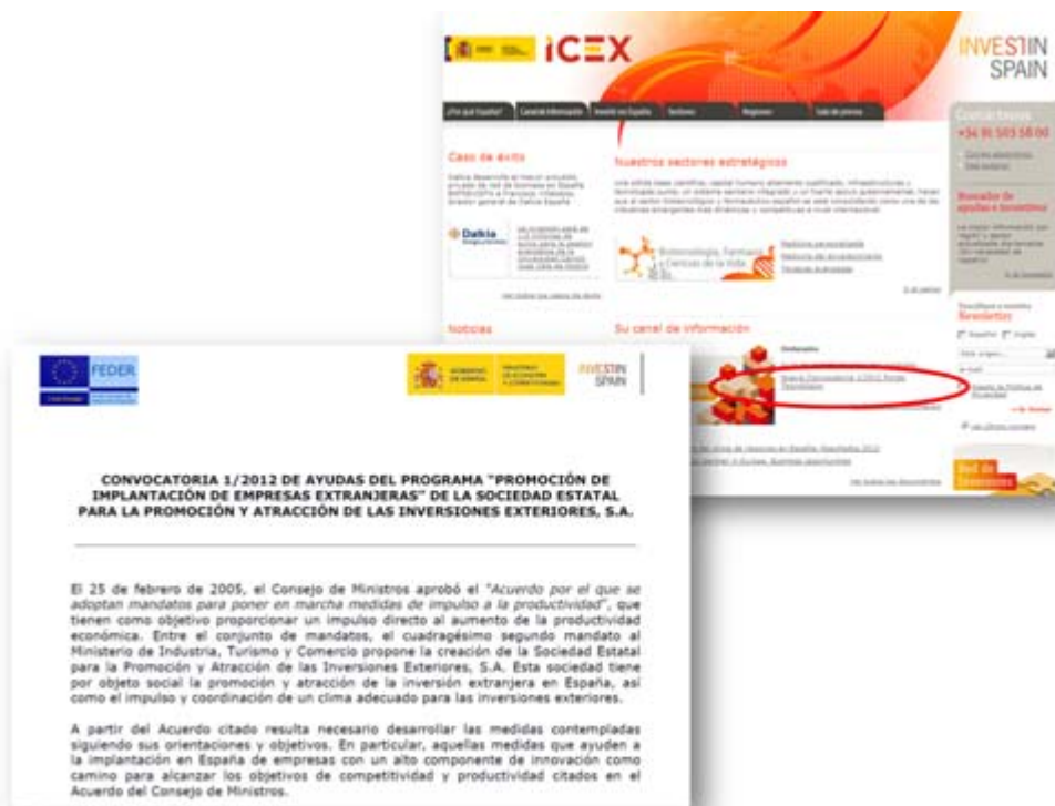
Publicación convocatoria ejercicio 2012

INVEST IN SPAIN cuenta con un Plan de Comunicación y Marketing propio, en línea con el Plan de Comunicación del programa elaborado para el Plan de Comunicación del Programa Operativo en el que participa con el objetivo de cumplir con la normativa comunitaria en materia de información publicidad.