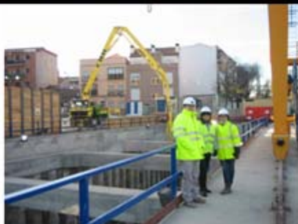
Imágenes del video de las medidas medambientales de reposición y imágenes de parte del equipo durante las obras

En cuanto a la adecuación al objetivo general de difusión de los fondos , se ha garantizado la buena difusión mediante varias sesiones y presentaciones específicas dedicada a difundir la ejecución de este importante proyecto para la ciudad de Madrid cofinanciado por Fondo de Cohesión, al que han sido invitadas autoridades de las distintas administraciones y agentes sociales. Se ha elaborado un video divulgativo y publicado folletos informativos para difundir la realización de este proyecto cofinanciado con el Fondo de Cohesión a la ciudadanía en general, con la inclusión del emblema de la Unión Europea, la referencia al Fondo de Cohesión.