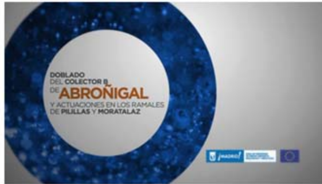
Presentación del video de "Doblado del colector Abroñigal y actuaciones en los ramales de Pillillas y Moratalaz"

Se considera una buena práctica de comunicación teniendo en cuenta los criterios establecidos al respecto.