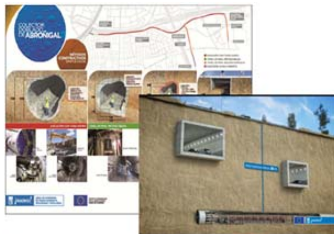
[imágenes de los recursos y presentación del video con vistas del colector B Abroñigal y métodos constructivos]

Por lo que respecta al Uso de recursos innovadores en la presentación, organización y/o desarrollo cabe señalar que se han llevado a cabo un video que utiliza métodos de presentación innovadores, poniendo a disposición de la ciudadanía una comunicación cercana u didáctica de la ejecución de un importante proyecto cofinanciado por el Fondo de Cohesión que se ha desarrollado minimizando el impacto de las obras sobre la ciudadanía y el medio ambiente. El uso de recursos innovadores se han combinado con tradicionales con el objetivo de informar al ciudadano de la mejor manera del proyecto y de los recursos de la UE.