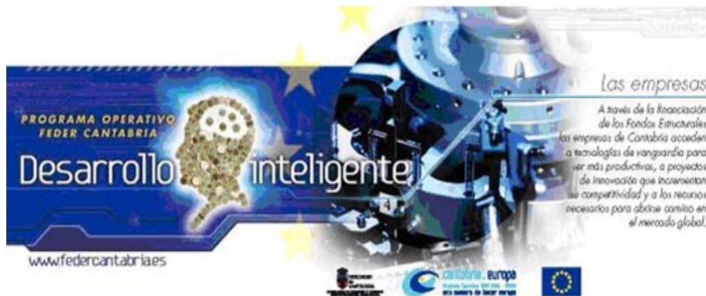
Anuncio para prensa

Por la adecuación con el objetivo general de difusión de los Fondos: Todas las acciones de comunicación han estado encaminadas a informar a la ciudadanía de la función del FEDER como fondo generador de beneficios para la Comunidad de Cantabria en términos de modernización, convergencia económica y bienestar social.