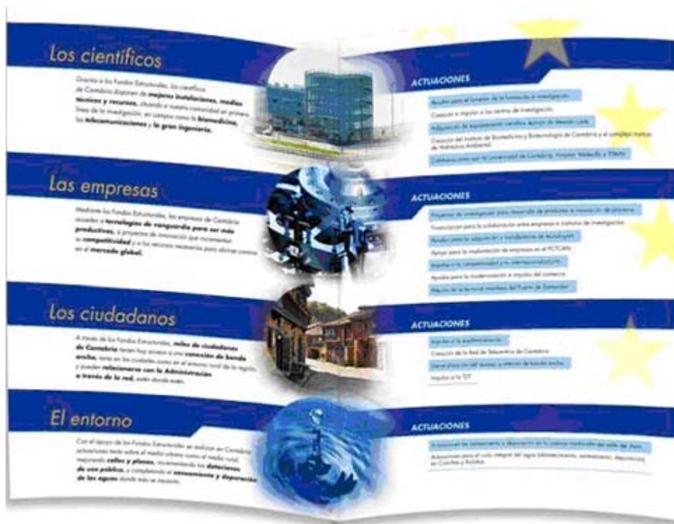
Interior folleto informativo

El folleto díptico contiene una información básica sobre las actuaciones realizadas en el marco del Programa Operativo, resumiendo los datos fundamentales de las mismas. La información se estructura por destinatarios (científicos, empresas, ciudadanos, medio ambiente), y el interactivo online permite introducir un elemento lúdico a través de una experiencia interactiva de gran riqueza sensorial.