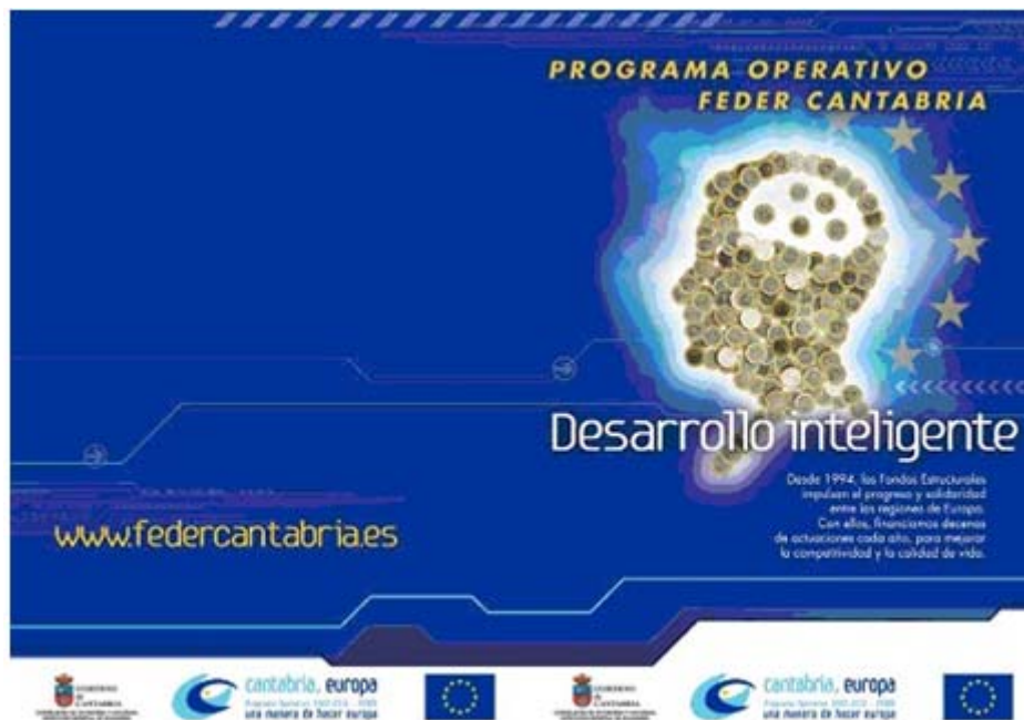
Exterior folleto informativo

En los contenidos de la campaña se ha atendido de forma equilibrada a los ejes temáticos que estructuran el Programa Operativo, y se han dado a conocer las actuaciones que en la ejecución del Programa Operativo FEDER de Cantabria 2007-2013 se han realizado y que han sido cofinanciadas por el FEDER