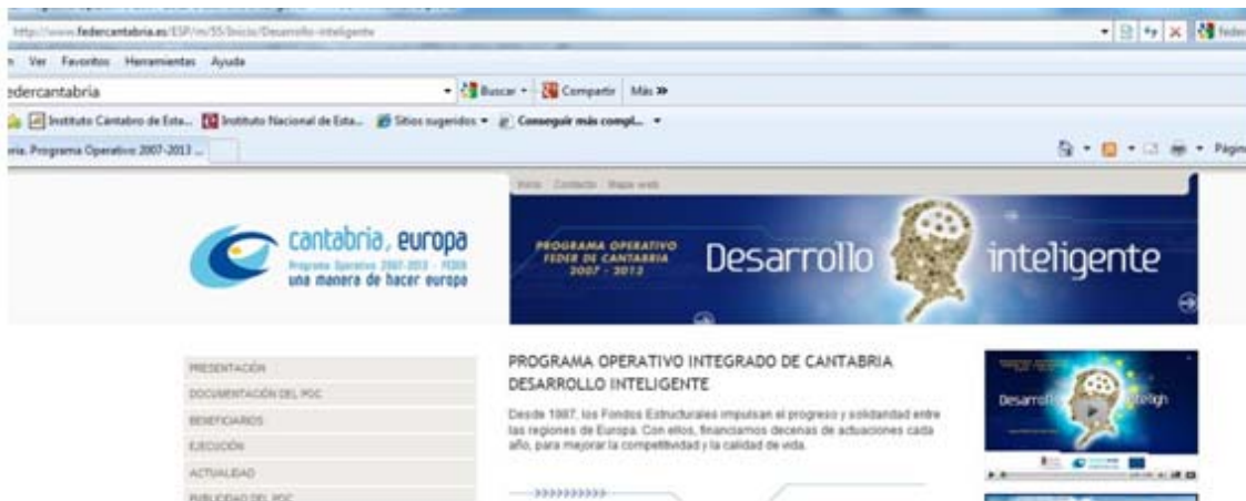
Web Programa Operativo FEDER Cantabria-Integración de Microsite divulgativo

El alto grado de calidad alcanzado, se manifiesta por la originalidad y diversidad de las acciones de comunicación adoptadas que han sido una buena manera de acercar el Programa Operativo FEDER de Cantabria 2007-2013 a la población cántabra.