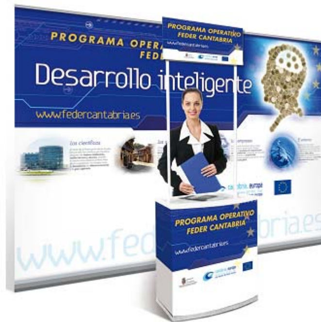
Stand en centros comerciales

En cuanto el uso de tecnologías de la información , queda patente porque Internet ha supuesto un medio de gran importancia para la realización de la campaña, pudiendo llegar de forma efectiva a su público objetivo y de forma segmentada y además con un coste menor.