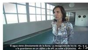
Cortijo San Francisco - Córdoba. Historia de éxito. InnoCámaras 162 visualizaciones • Hace 8 meses