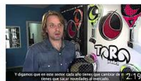
Toro Pádel - Cáceres. Historia de éxito. InnoCámaras 535 visualizaciones • Hace 8 meses