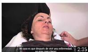
Sancha Cosmética y Color - Badajoz. Historia de éxito. InnoCámaras 248 visualizaciones • Hace 8 meses