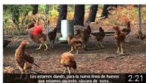
Galo Celta - Pontevedra. Historia de éxito. InnoCámaras 116 visualizaciones • Hace 8 meses