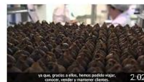
Productos la Higuera - Cáceres. Historia de éxito. InnoCámaras 98 visualizaciones • Hace 8 meses