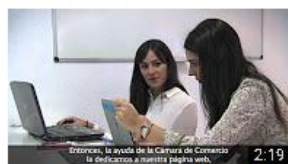
menteágil - Córdoba. Historia de éxito. InnoCámaras 157 visualizaciones • Hace 8 meses