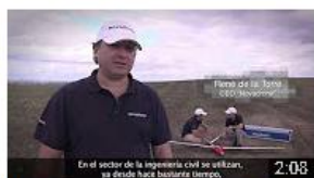
Novadrone – Sevilla. Historia de éxito. InnoCámaras 187 visualizaciones • Hace 8 meses