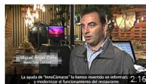
Grupo Corredera - Cádiz. Historia de éxito. InnoCámaras 278 visualizaciones • Hace 8 meses