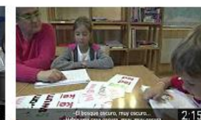
Colour Trick - Gijón. Historia de éxito. InnoCámaras 47 visualizaciones • Hace 9 meses