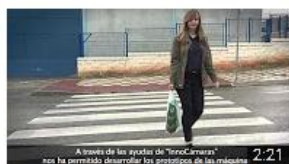
Sercampo - Cuenca. Historia de éxito. InnoCámaras 93 visualizaciones • Hace 8 meses