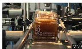
Lorusso y Sáez - Almería. Historia de éxito. InnoCámaras 573 visualizaciones • Hace 8 meses