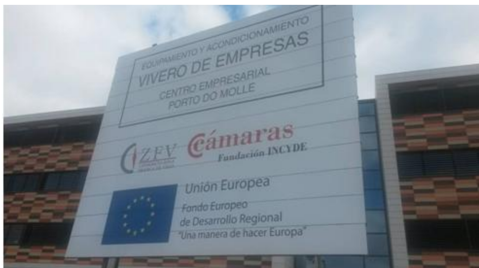
Imagen de la valla de obra donde figura el logo del FEDER