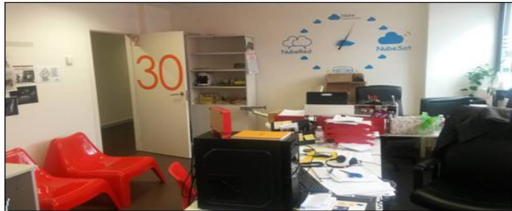
Fotos despachos emprendedores

Gracias a la cofinanciación de los Fondos FEDER, en un 85%, se ha podido llevar a cabo la creación de esta incubadora de empresas, por medio de la cual, y una vez transcurridos solamente unos meses desde su puesta en funcionamiento, se ha promovido el impulso empresarial de la región, tal y como demuestra el 100% de la ocupación.