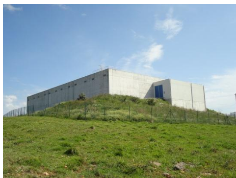
Depósito de Pruvia