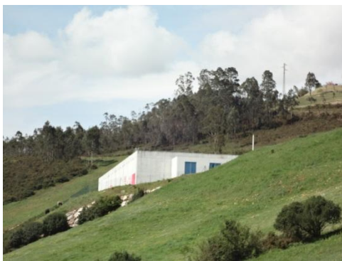
Depósito de Mundin

El proyecto contempla la ejecución de dos nuevos depósitos, uno en Pruvia y otro en el Mundín, así como de varios tramos de conducciones nuevas y la renovación de otras.