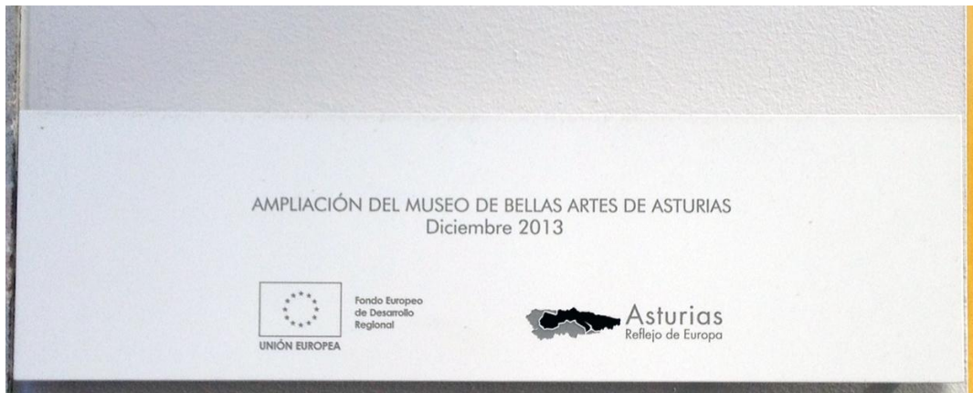
Placa informativa instalada a la entrada de la Ampliación