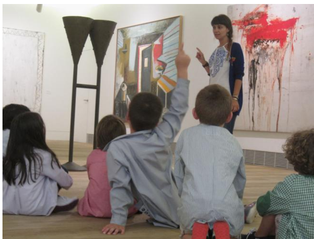
Una actividad para niños en la Ampliación

La programación educativa del Museo se oferta con periodicidad cuatrimestral, salvo en el caso de las actividades para escolares, que coinciden con el desarrollo del curso académico, y está enriquecida por un variado programa de ciclos de cine, conferencias y conciertos, entre otras actividades. Tanto la entrada al Museo como la participación en cada una de estas actividades son gratuitas.