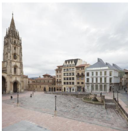
Vista exterior de la Ampliación

La zona de ampliación, que da a la calle de la Rúa y llega hasta la plaza de la Catedral, se ha convertido en el principal acceso a la pinacoteca asturiana y alberga tres plantas destinadas a exponer las obras desde el siglo XIX hasta la actualidad.