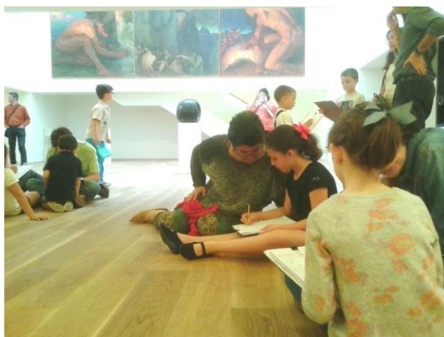
Desarrollo actividad para familias en la ampliación

En este sentido destaca el desarrollo de actividades no solo para escolares sino también para familias. Además se ofrece un variado programa para personas con necesidades especiales, que incluye desde visitas guiadas con audio-descripción y recorridos táctiles para personas con discapacidad visual, visitas guiadas y talleres adaptados para personas con discapacidad intelectual, visitas especiales dirigidas a personas mayores con necesidades especiales, visitas para jóvenes y talleres inclusivos orientados a personas afectadas con trastornos del espectro del autismo y, por último, actividades específicas para colectivos en riesgo de exclusión social (transeúntes, jóvenes en centros de menores), para mujeres en centros de acogida y mujeres en tratamiento por algún tipo de adicción ( Y yo...¿qué pinto aquí? ). También se han implementado visitas monográficas con intérprete de lengua de signos para visitantes con discapacidad auditiva, actualmente no activas.