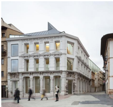
Vista exterior de la Ampliación

La zona de ampliación, que da a la calle de la Rúa y llega hasta la plaza de la Catedral, se ha convertido en el principal acceso a la pinacoteca asturiana y alberga tres plantas destinadas a exponer las obras desde el siglo XIX hasta la actualidad.