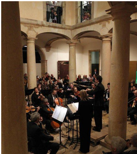
Arriba, uno de los conciertos celebrados en el Museo

También se innova en cuanto a los contenidos, organizando actividades muy diferentes. Así se organizan conciertos que abarcan desde la música clásica hasta el jazz y la música electrónica y un ciclo de cine en el que cada cuatrimestre se viene analizando, a través de cuatro películas por ciclo, las relaciones entre el cine y la pintura. También se realizan representaciones teatrales en torno a la literatura y su relación con las colecciones del Museo y se participa activamente con distintas propuestas artísticas en la Noche Blanca.