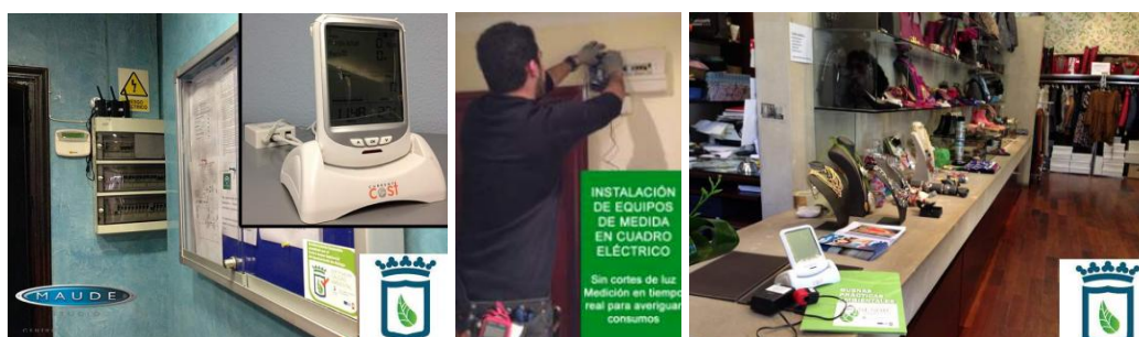
Asesoramiento en Eficiencia Energética. Medidores energéticos inteligentes instalados en empresas e instalación.