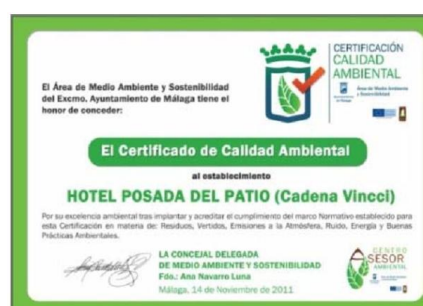
Certificado de Calidad Ambiental Municipal. Distintivo identificativo para la empresa, como establecimiento certificado y como establecimiento incluido en la Red de Establecimientos Sostenibles.