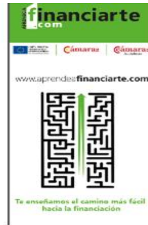
Roll up de Aprende a FinanciarTE