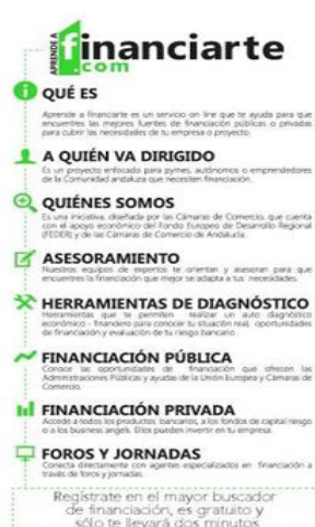
Contraportada Flyer Aprende a Financiar