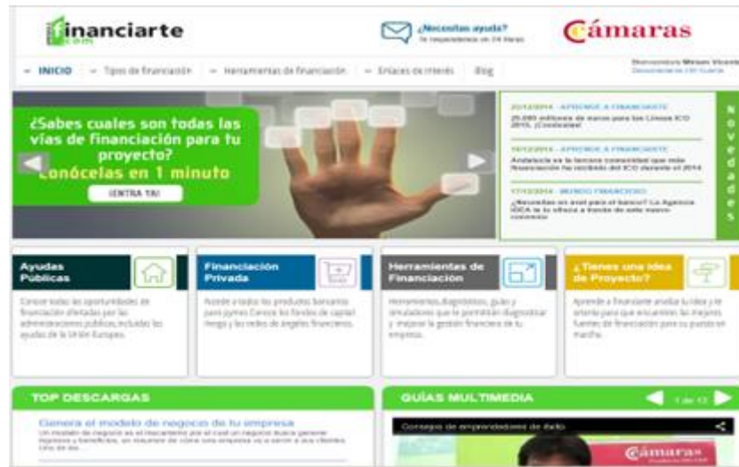
Pantallazo plataforma www.aprendeafinanciarte.com

Cofinanciación FEDER, al 80%, de 1.900.000 €