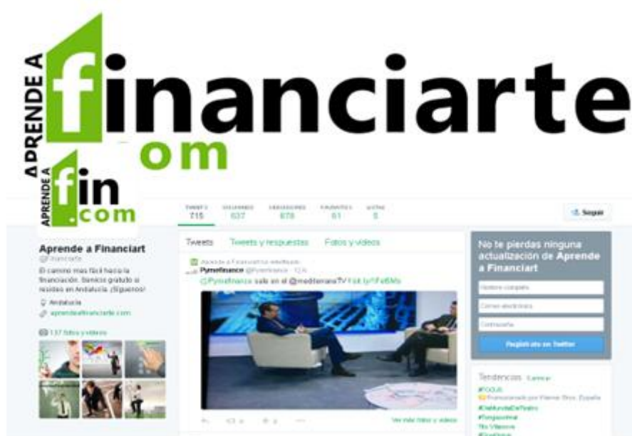
Perfil de Aprende a Financiar en Twitter

El programa tiene gran difusión a través de redes sociales dónde también se actualiza con contenidos de actualidad.