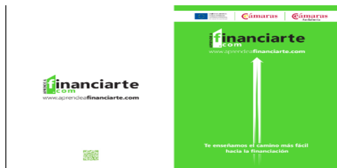
Carpeta de Aprende a FinanciarTE