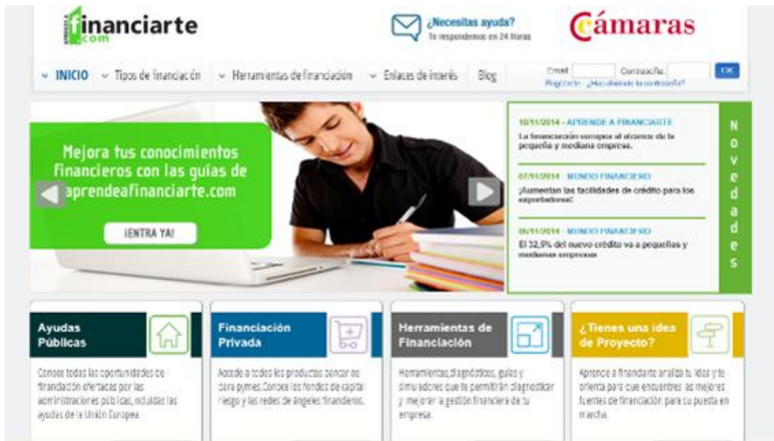
Pantallazo Ayudas públicas, financiación privada, herramientas de financiación autodiagnóstico