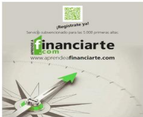
Parte posterior del folleto de Aprende a FinanciarTE