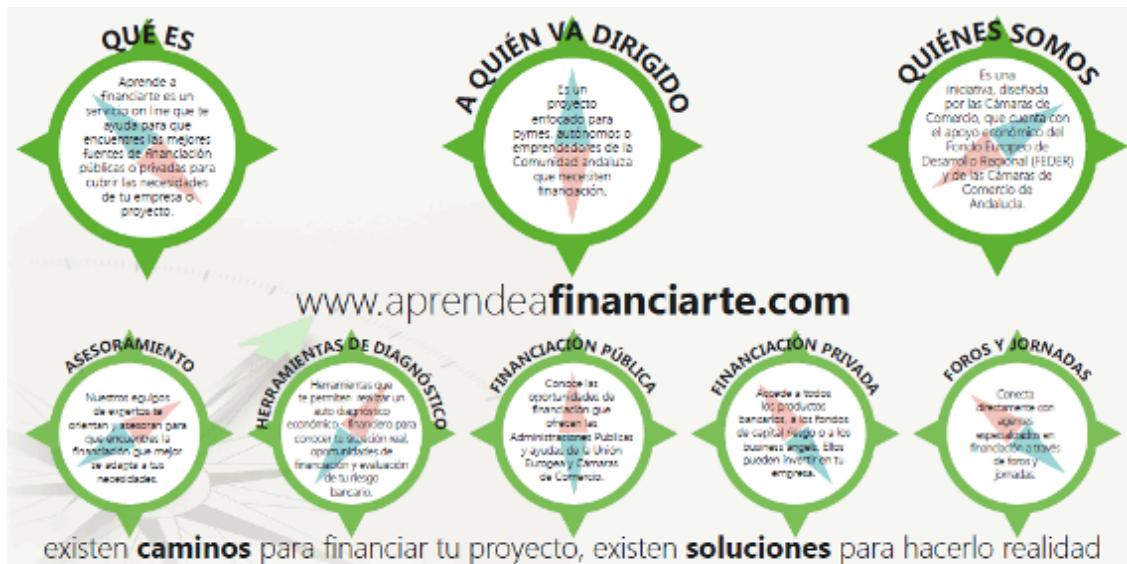
Interior del Folleto de Aprenda a Financiar