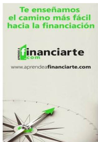
Portada Flyer Aprende a Financiar