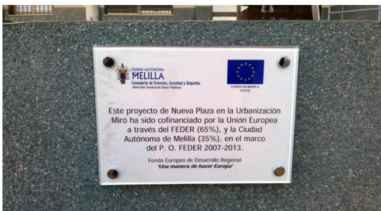
Placa conmemorativa permanente

A la finalización de las obras se instaló placa conmemorativa permanente en un lugar fácilmente visible. Además se colgó una noticia en el canal de difusión autonómico MelillaMedia, dependiente de la Dirección General de la Sociedad de la Información, concretamente en el enlace http://www.melillamedia.es/noticia/3304 , acompañada de un vídeo en el que se hace un recorrido virtual de la plaza. La inauguración, asimismo, tuvo una amplia cobertura mediática en prensa y televisión local (en los informativos de TVM).