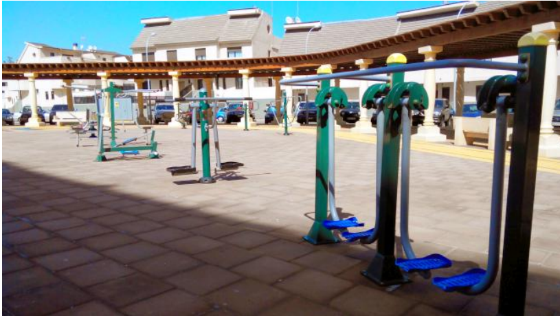
Zona de gimnasia al aire libre