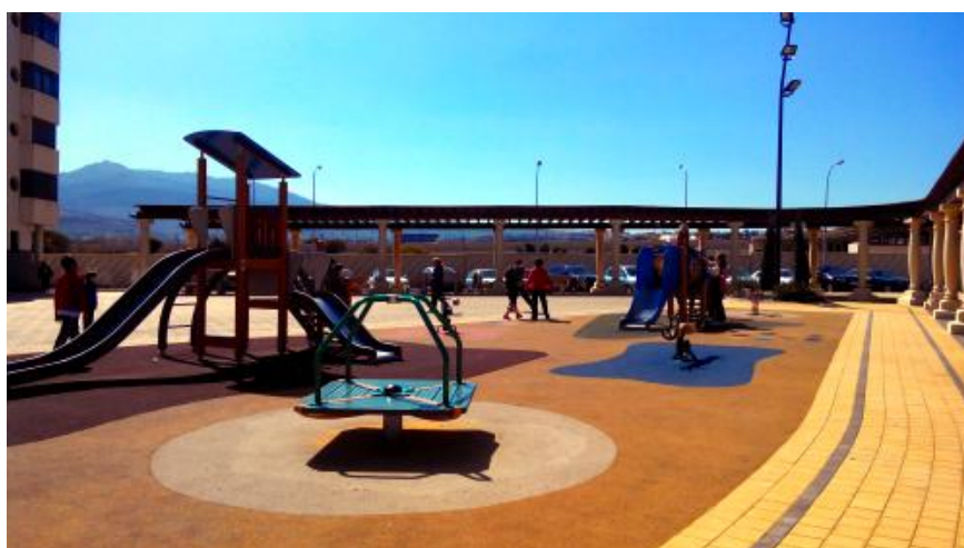
Zona de juegos infantiles