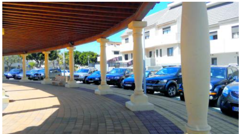
Zona de sombra proporcionada por la pérgola

Se considera una buena práctica por el cumplimiento de los siguientes criterios: