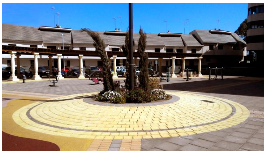
Arriate central de la Plaza

El coste de la operación ascendió a 555.000 euros, de los que el FEDER ha cofinanciado el 80%. Las obras se iniciaron en octubre de 2012 y finalizaron en marzo de 2013.