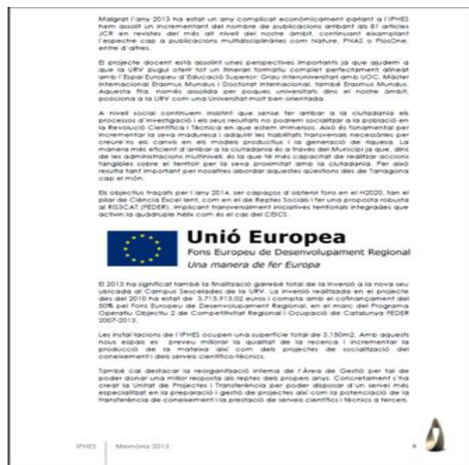
Memoria anual 2013 del IPHES

En las memorias anuales del IPHES, concretamente en el apartado de datos generales del centro, se hace constar la referencia de la cofinanciación FEDER de la nueva sede corporativa.