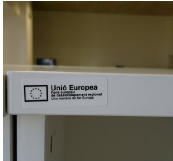
Placa explicativa permanente y adhesivos en del mobiliario y equipamiento

En las memorias anuales del IPHES, concretamente en el apartado de datos generales del centro, se hace constar la referencia de la cofinanciación FEDER de la nueva sede corporativa.