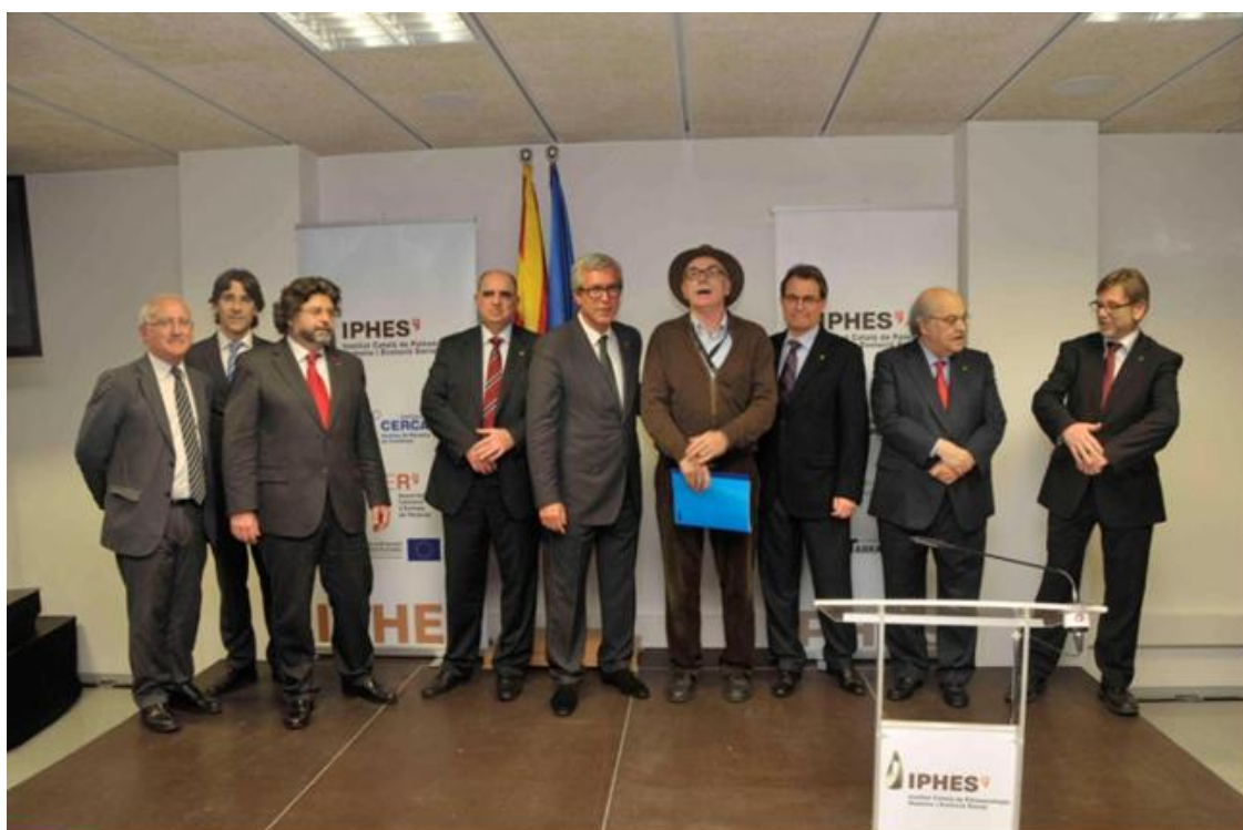
Foto de la inauguración