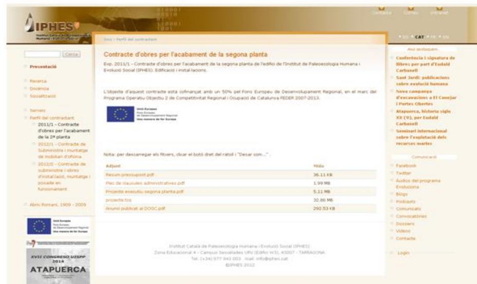
Página web del IPHES

En los accesos principales al edificio se han colocado varias placas explicativas con el emblema de la UE, la referencia al FEDER y la declaración escogida por la Autoridad de Gestión: Una manera de hacer Europa. También se incluye ese emblema en los adhesivos colocados en todo el mobiliario equipamiento específico de I+D que forman parte de la operación cofinanciada.