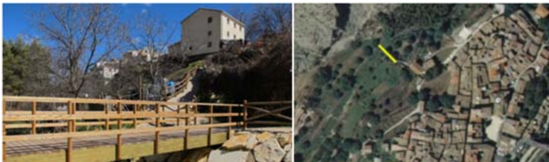
Mejora de accesos desde el municipio de Nerpio, conectividad entre ambos márgenes del río Tabilis mediante la creación de una nueva pasarela peatonal de madera y mejora de una ya existente.

Este proyecto es un buen ejemplo de la política que viene desarrollando la CHSegura para distribuir al máximo las inversiones cofinanciadas con fondos comunitarios en igualdad de oportunidades, ofreciendo soluciones de futuro a los municipios más desfavorecidos que, quizás por su tamaño, no han venido recibiendo la debida atención por parte de las autoridades competentes.