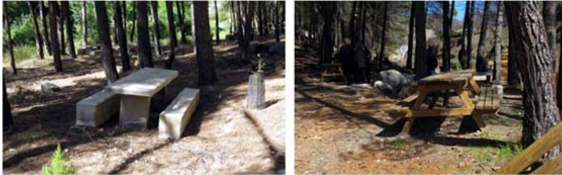
Fotografías del antes y el después: acondicionamiento y mejora medioambiental de una de las áreas recreativas, incluso la creación de un mirador y observatorio de aves y realización de actuaciones para la mejora de las poblaciones faunísticas mediante la colocación de cajas nidaderas.

El tramo del río Taibilla objeto de la intervención se encuentra fuertemente vinculado al uso por parte de la población. Por esta razón, un objetivo fundamental ha sido la potenciación del uso recreativo en este espacio natural de manera integrada, respetuosa y compatible con su conservación; aportando, al mismo tiempo, conocimientos sobre sus valores naturales y culturales.