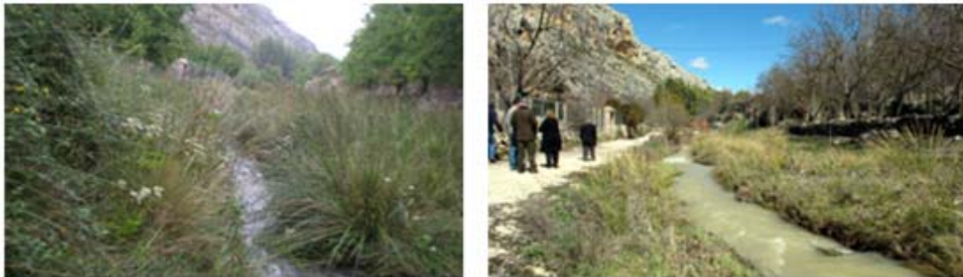
Fotografías del antes y el después, donde se observa la mejora de la capacidad hidráulica del río Taibilla, la eliminación de vegetación intrusiva del cauce y el acondicionamiento de senda peatonal para disfrute de los ciudadanos.

Con las actuaciones llevadas a cabo a través de este proyecto se ha pretendido preservar y mejorar la calidad ecológica y ambiental de la zona fluvial del río Taibilla, afluente del río Segura; recuperando los ecosistemas y el paisaje de la zona húmeda y riparia; así como mejorar la calidad del recurso hídrico. Además, también se ha buscado la potenciación del uso recreativo en este espacio natural de manera integrada. En este sentido, se han acometido actuaciones relacionadas con la restauración del medio natural, como la estabilización y defensa del cauce del río Taibilla y la revegetación con especies de ribera. Estas actuaciones están incidiendo de manera positiva en la recuperación ecológica y paisajística de la zona húmeda y riparia, así como en la mejora de la calidad del recurso hídrico.