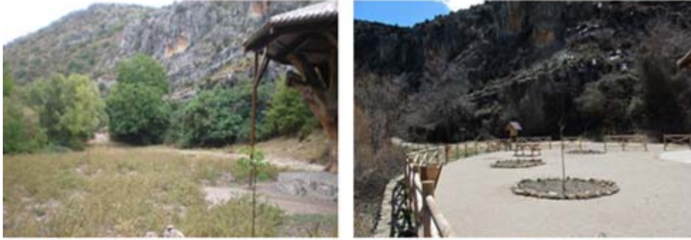
Fotografías del antes y el después: acondicionamiento y mejora medioambiental del entorno del Plantón del Covacho, mediante delimitación con talanquera de madera, mejora del firme y colocación de carteles informativos. Plantación de 8 nogales en el entorno del Plantón del Covacho, fomentando el patrimonio cultural de Nerpio.

El Ayuntamiento ha venido recogiendo esta preocupación de los ciudadanos y ha solicitado la atención de las autoridades y la concienciación de los vecinos para proteger y conservar estas especies que añaden valor a su atractivo natural como destino ecoturístico nacional. A través del proyecto se han plantado 95 nogales ( juglans regia ) y 85 pinos ( pinus halapensis ).