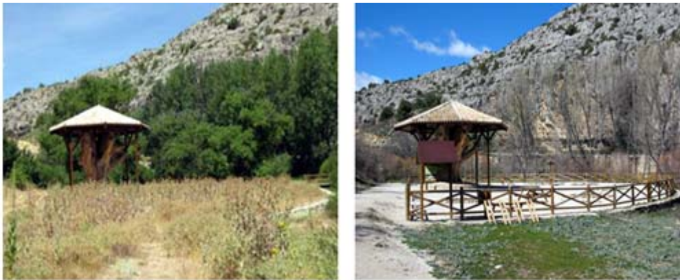
Fotografías del antes y el después: acondicionamiento y mejora medioambiental del entorno del Plantón del Covacho, mediante delimitación con taianquera de madera, mejora del firme, colocación de mobiliario rústico y colocación de carteles informativos.

También se ha mejorado la estructura del templete y la accesibilidad a este entorno, adecuando la pasarela peatonal existente que lo conecta con la carretera.