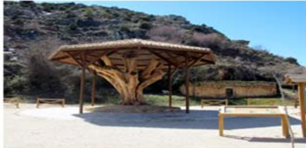
En estas fotografías comparativas se observa el aspecto del entorno de El Plantón del Covacho antes y después de la realización de las obras