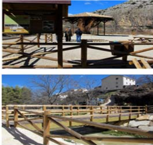
Vistas de la talanquera colocada en la zona de El Plantón del Covacho (foto superior) y la que protege la nueva pasarela que conecta el casco urbano con la ruta ecoturística.

aprovechando en lo posible los caminos y senderos existentes. La primera zona se sitúa en el entorno del río Taibilla junto al casco urbano de Nerpio, mejorado también la conectividad y accesibilidad desde dicho casco urbano. La segunda área, aguas arriba de la primera, se trata de la parcela donde se encuentran los restos de El Plantón del Covacho, nogal milenario y emblemático, considerado un símbolo para los nerpianos. En la adecuación de los espacios, se ha procedido a la instalación del mobiliario rústico necesario para su uso sostenible, plantación de arbolado y colocación de talanqueras.