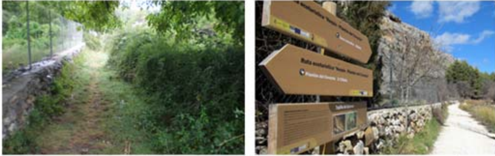
Fotografías del antes y el después: acondicionamiento de senda peatonal con colocación de cartelería informativa y mejora de la accesibilidad para las personas, incluso aquellas con movilidad reducida.

Como resultado de este proyecto se ha establecido la Ruta Ecoturística Nerpio-Plantón del Covacho, asociada al entorno fluvial, cultural y medioambiental del área de actuación. En el término municipal de Nerpio existen múltiples recorridos turísticos para senderistas que se encuentran profusamente señalizados por todo el entorno de la población.