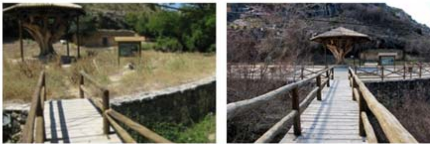
Fotografías del antes y el después: Mejora del acceso al Plantón del Covacho

El Plantón del Covacho era una noguera centenaria que fue declarada oficialmente árbol singular por el Gobierno regional en marzo de 1992 (Orden 13/3/1992). Había sido adquirido por la Junta de Comunidades para evitar su tala, después de una movilización ciudadana que reclamó la protección de este secular árbol.