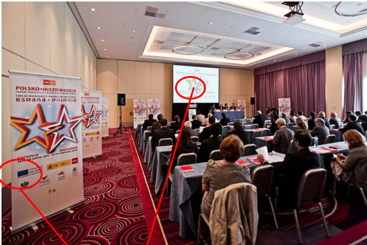
(Seminario práctico sobre la Inversión Española en Polonia celebrado durante el Foro)