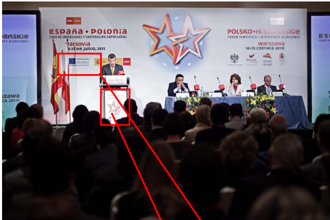
(Acto de inauguración del Foro)