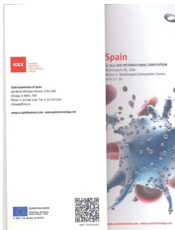
(Catálogo expositores en papel)