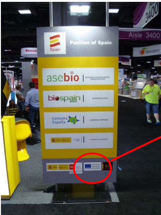
(Panel pie stands - revés)