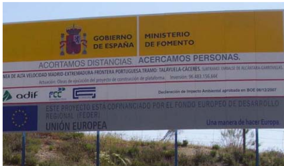
Carteles de obra