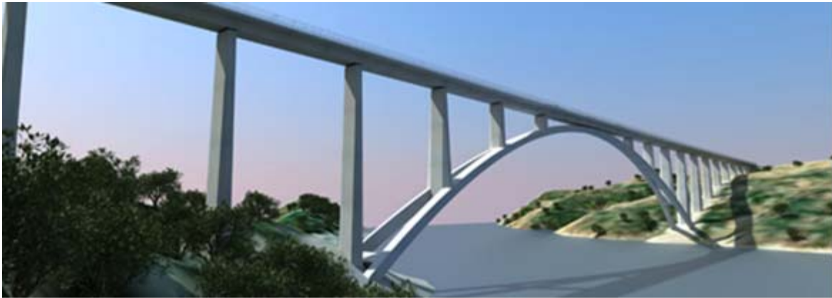
Infografía del viaducto

El viaducto de Almonte cruza el río del mismo nombre, en el embalse de Alcántara dentro del tramo Embalse de Alcántara-Garrovillas de la línea de alta velocidad Madrid-Extremadura.