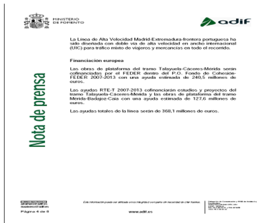
Notas de Prensa

Descripción de la línea y sus estructuras singulares en la web de ADIF: