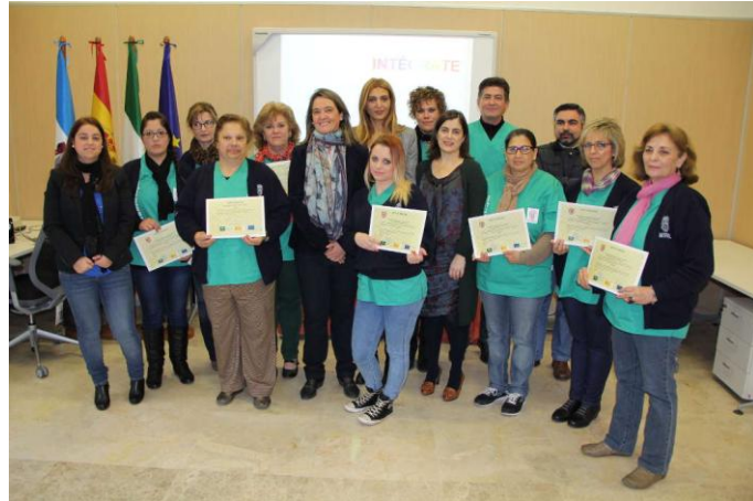
Foto: Entrega de diplomas a mujeres desempleadas