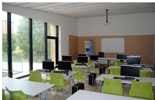
Foto 2: aula informática del Centro de Servicios Sanitarios y Sociales