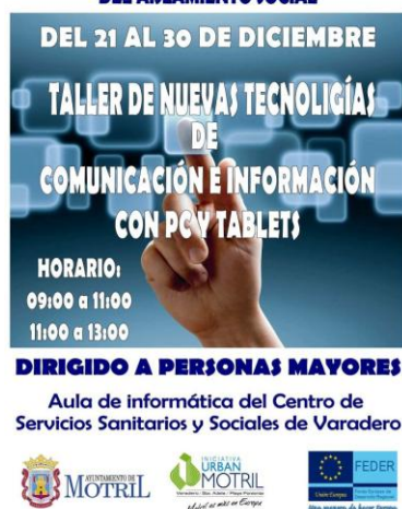
Foto: talleres de informática dirigida a personas mayores.