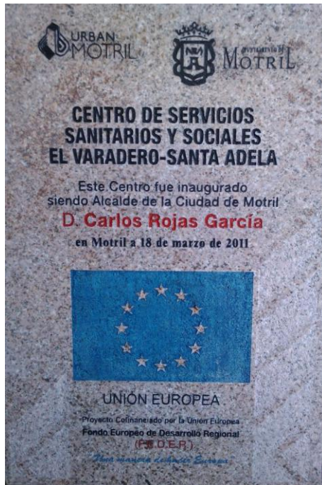
Foto: Placa definitiva del Centro de Servicios Sanitarios y Sociales

Por tanto existe un gran conocimiento de esta actuación así como de la cofinanciación recibida por parte de la Unión Europea, por parte tanto vecinos de la zona URBAN (Varadero, Santa Adela y Playa Poniente), por el resto del municipio de Motril y al estar junto a la playa, es donde los visitantes y veraneantes reciben asistencia sanitaria en caso de necesitarla, por lo tanto existe una gran conocimiento de esta actuación cofinanciada tanto por los motrileños como por los turistas que visitan nuestra ciudad