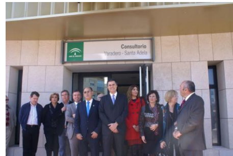
Foto: Inauguración del Centro de Servicios Sanitarios y Sociales con autoridades de diferentes administraciones públicas: Junta de Andalucía y Ayuntamiento de Motril.