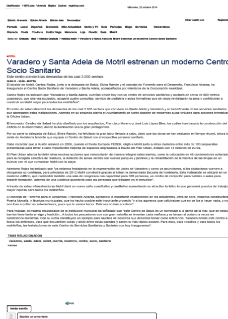
Foto: Recorte de la noticia de la Inauguración del Centro de Servicios Sanitarios y Sociales (FEDER).