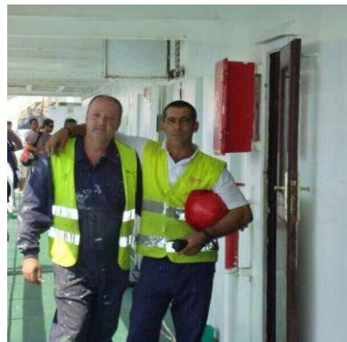
Foto: Alumnos de cursos de formación marítima, formado dentro de la Iniciativa Urbana de Motril, cofinanciado por el FEDER, algunos provienen de la pesca y otros sin ningún tipo de experiencia. Ahora son trabajadores de la Naviera ARMAS como marinero o como personal de fonda.

Por ello creemos que con la construcción del Centro de Servicios Sanitarios y Sociales, actuación enmarcada en la Iniciativa Urbana de Motril, cofinanciada por la Unión europea con cargo al FEDER, se han conseguido una correlación entre la inversión de estos fondos dentro de la iniciativa urbana y los resultados que se han obtenido y esperan obtener, hace que día a día la zona se desarrolle y se genere más empleo.