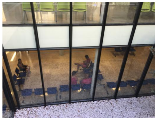
Foto: Inauguración y funcionamiento del Consultorio de la Consejería de Salud de la Junta de Andalucía.

La segunda planta del Centro de Servicios Sanitarios y Sociales, se encuentran las aulas de formación donde se han impartido cursos de formación orientados a yacimientos emergentes de empleo, como los cursos que se han impartido, también cofinanciados por el FEDER por valor de 69.142,40 €, de cofinanciación, y se ha conseguido una gran inserción laboral, más de 250 alumnos se han formado de los cuales más 180 alumnos han pasado entrevistas de trabajo y están trabajando de forma estable, la mayoría y en forma de refuerzo en los barcos de la Naviera Armas. Con lo que el grado de inserción laboral ha sido muy elevado.