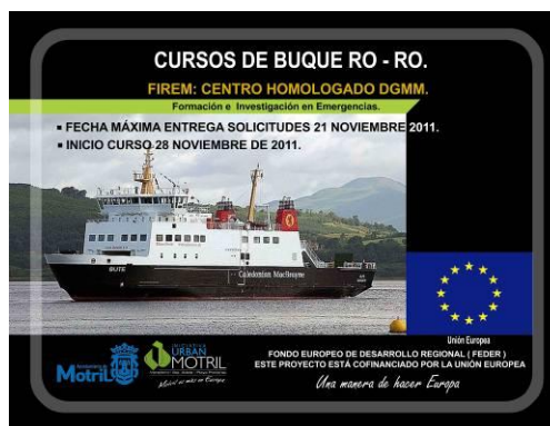
Foto: Alumnos cursos formación marítima Foto: Cartel Curso Formación marítima

Por tanto, aunque la buena práctica de actuación cofinanciada es el centro de servicios sanitarios, se han realizado diferentes actuaciones que complementan y hacen que cumpla con los criterios para la identificación y selección de esta actuación como buenas prácticas de actuaciones cofinanciadas: