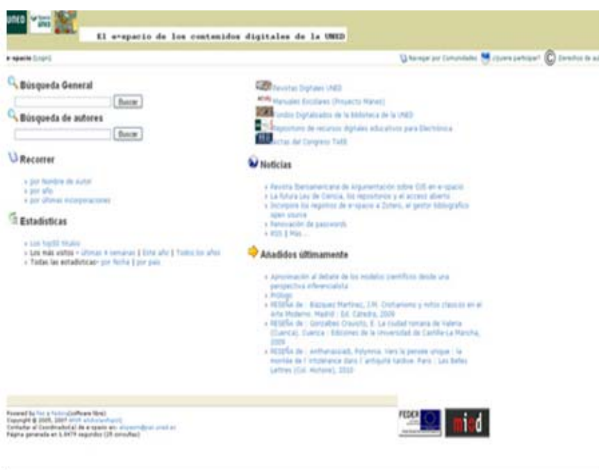
E-Espacio UNED. Repositorio institucional

Dicha iniciativa promueve el acceso libre a la literatura científica, incrementando el impacto de los trabajos desarrollados por los investigadores y contribuyendo a mejorar el sistema de comunicación científica y el acceso al conocimiento. Muchos otros repositorios de Universidades en todo el mundo participan en este movimiento. Los repositorios institucionales son conformes con protocolos comunes que permiten que sus contenidos sean indizados por Google y Google Scholar y por otros sistemas que pueden crear servicios con esos contenidos dándoles así una mayor difusión.